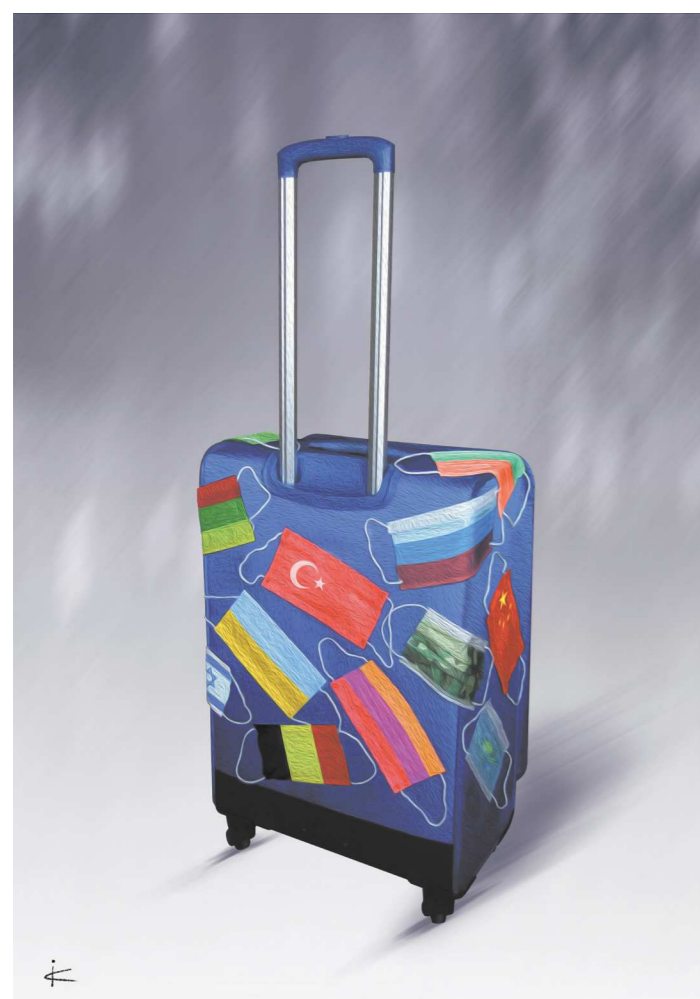
Илья Катц / Израиль