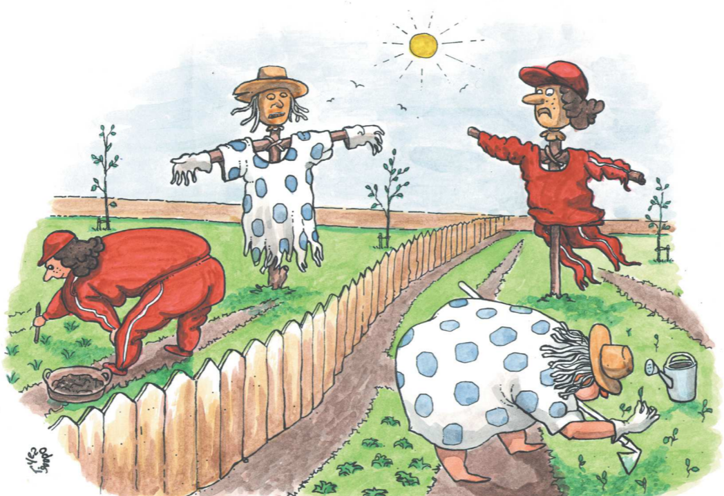
Геннадий Чегодаев / Россия