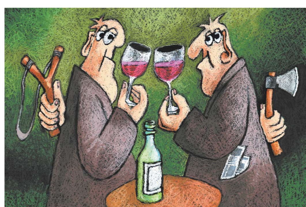
Иржи Срна / Чехия