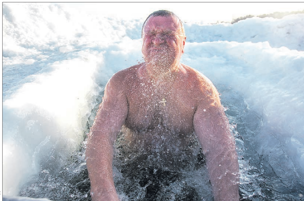
В купели не нужно плавать: достаточно нескольких секунд, чтобы трижды окунуться в воду

Это же мнения придерживается и Екатеринбургская епархия. Там рекомендуют сосредоточиться на духовной составляющей праздника и внимательно относиться к своему здоровью и мерам санитарно-эпидемиологической безопасности.