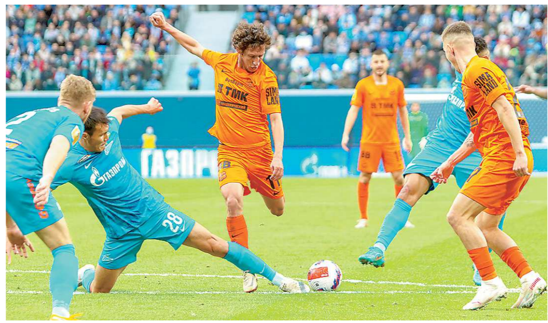
«Урал» потерпел второе поражение подряд в чемпионате России

Футбольный клуб «Урал» потерпел поражение в 25-м туре чемпионата России. «Шмели» на выезде уступили действующему победителю турнира и лидеру таблицы – санкт-петербургскому «Зениту» (1:3).