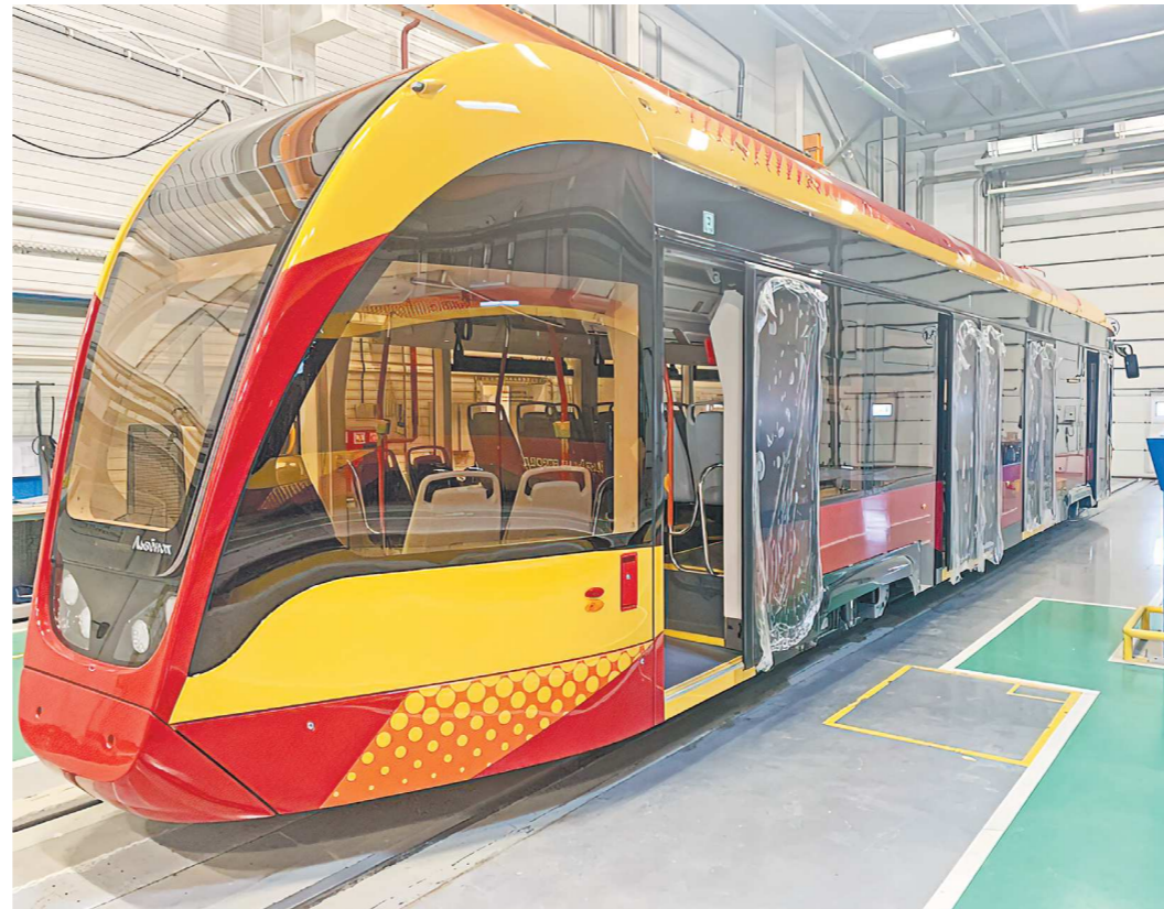
Трамвай «Львенок» выпускаются только в односекционном варианте