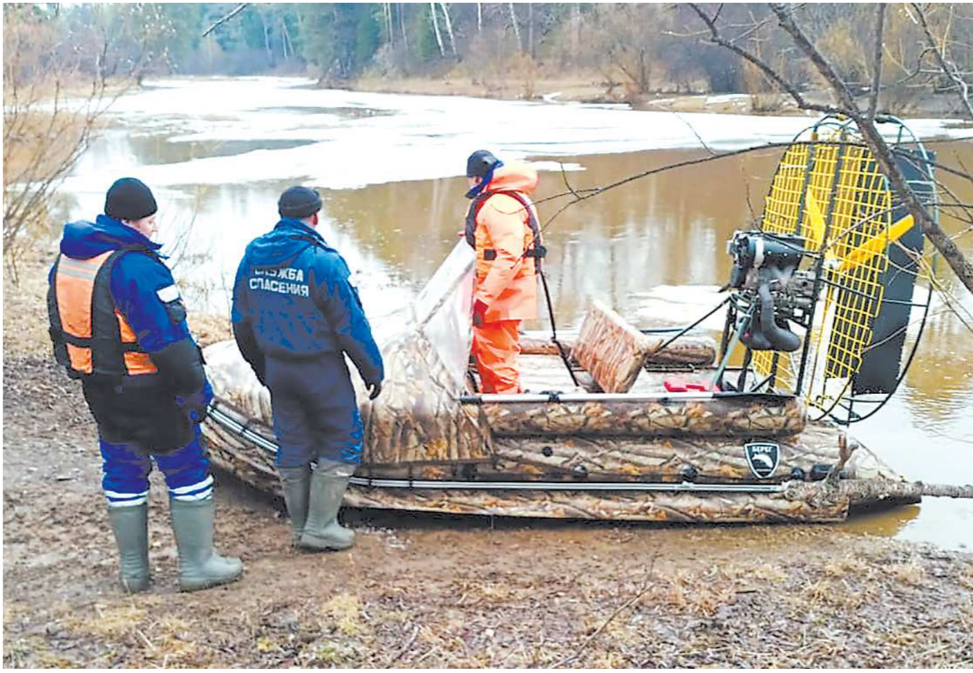
Сотрудники МЧС развернули поисковую операцию в связи с тем, что туристы не добрались к назначенному времени в конечную точку маршрута