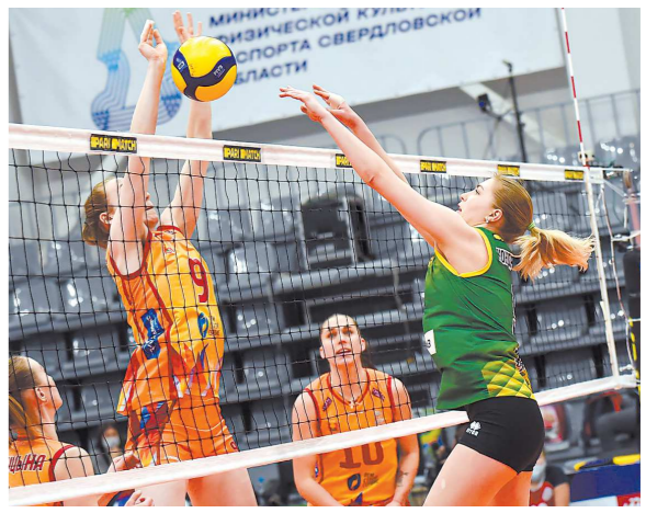
До «Липецка» «Уралочка» обыграла «Ленинградку» и «Заречье-Одинцово»

Волейбольный клуб «Уралочка-НТМК» продлил победную серию. Команда Михаила КАРПОЛЯ одержала третью подряд победу в чемпионате России, обыграв на выезде «Липецк» – 3:0.