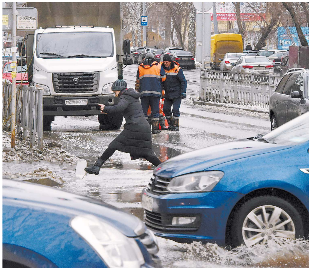
На многих перекрёстках в Екатеринбурге сложно пройти и не намочить ноги

ГОСУДАРСТВЕННОЕ БЮДЖЕТНОЕ УЧРЕЖДЕНИЕ СВЕРДЛОВСКОЙ ОБЛАСТИ «РЕДАКЦИЯ ГАЗЕТЫ "ОБЛАСТНАЯ ГАЗЕТА"». ОБЩЕСТВЕННО-ПОЛИТИЧЕСКОЕ ИЗДАНИЕ