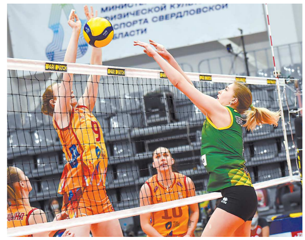
До «Липецка» «Уралочка» обыграла «Ленинградку» и «Заречье-Одинцово»

Волейбольный клуб «Уралочка-НТМК» продлил победную серию. Команда Михаила КАРПОЛЯ одержала третью подряд победу в чемпионате России, обыграв на выезде «Липецк» – 3:0.