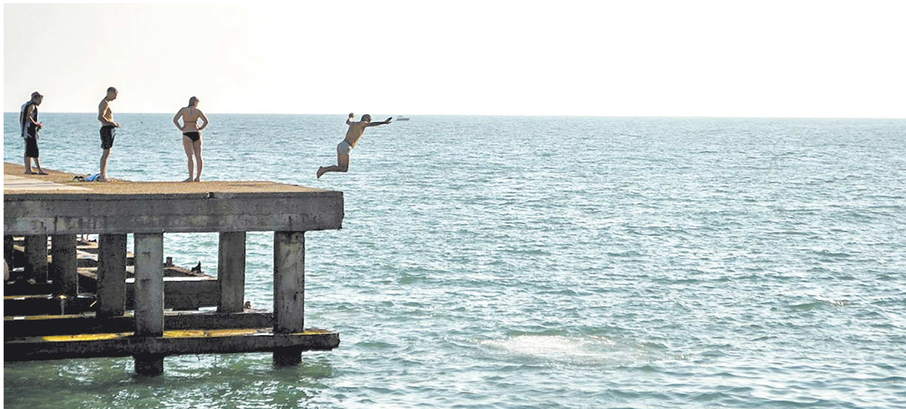
Отдохнуть можно без особого урона для кошелька, если подойти к вопросу тщательно

Проект молодёжного и студенческого туризма был