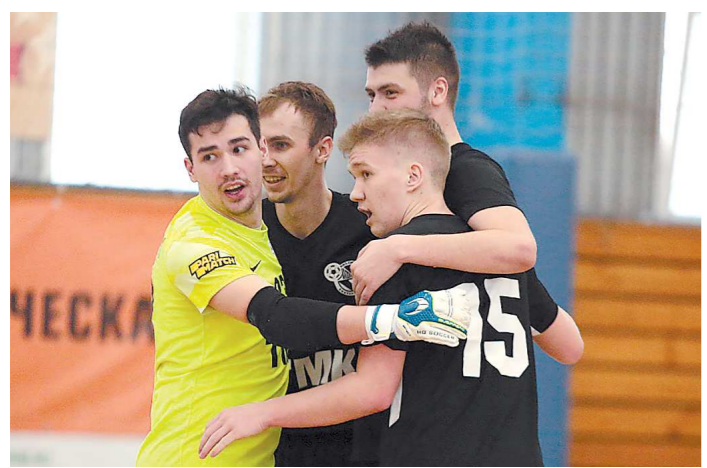
«Синара» набрала максимальное количество очков в домашнем туре с «Тюменью»