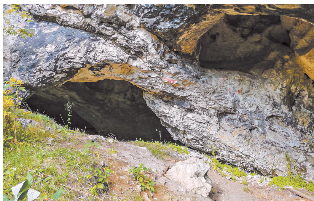
В пещере Гебауэра обнаружены стоянки древнего человека

ные жернова. Мельница и принадлежавшие ей склады были построены в середине XIX века. Часть здания сгорела в апреле 1945-го. На тот момент целело три дома и турбина. Но до наших дней сохранилось только каменный остов строения. Последний пожар в 2019 году уничтожил деревянный дом управляющего мельницей. На главный вопрос, волнующий путешественников, – обитают ли здесь привидения? – каждый ищет ответ самостоятельно, – рассуждает Ельнякова.