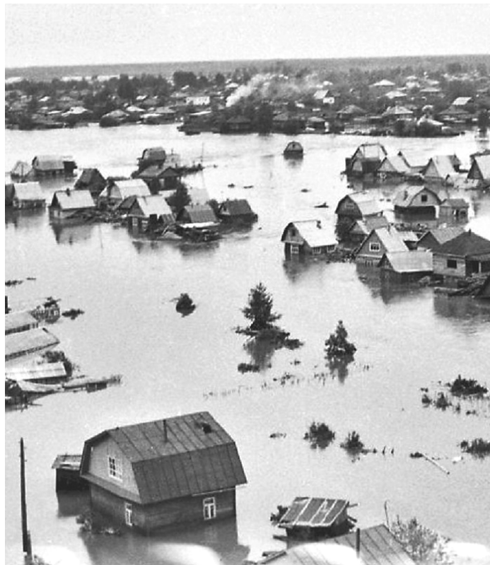
В 1993 году в Серове произошел прорыв дамбы. В результате наводнения большая часть города оказалась затопленной

«Областная газета» составляет свой рейтинг, ждём предложений от наших читателей.