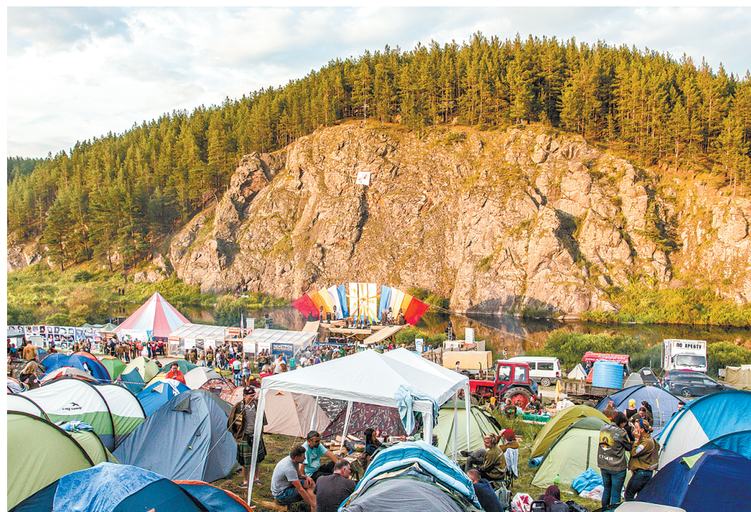
Более 40 лет любители авторской песни со всех уголков страны проводят у Дивьей горы фестиваль «Знаменка». Сегодня трудно представить, что когда-то эта гора была действующим подводным вулканом

– Безусловно. Уже начали подготовку. Ждём с нетерпением встречи с рекой.