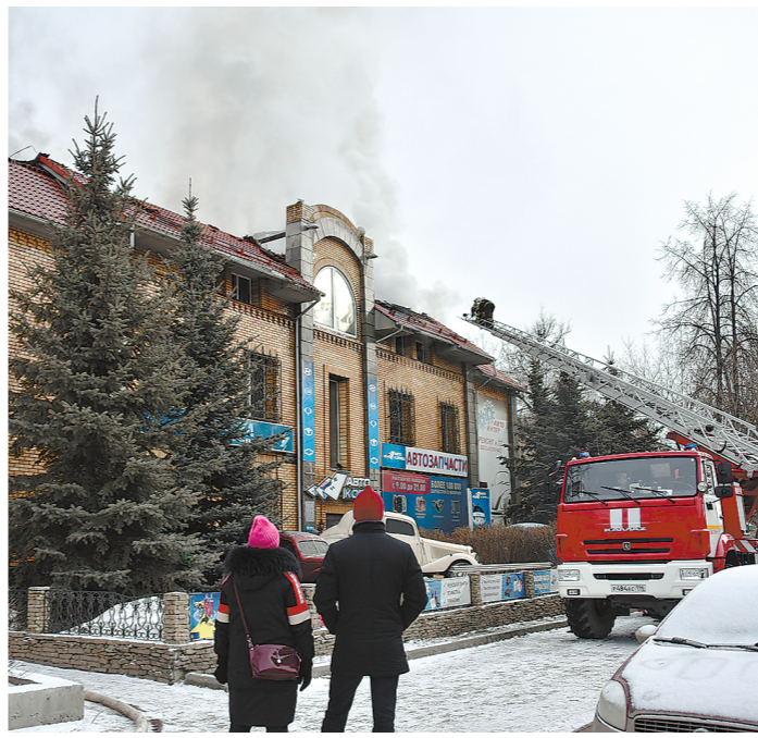
Екатеринбургские пожарные локализовали возгорание за три часа