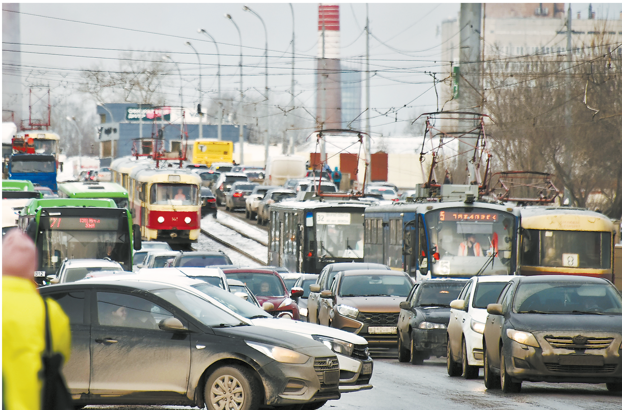
Вчера утром жители екатеринбургского микрорайона ЖБИ могли выбраться на работу только пешком: весь транспорт стоял

В последний мартовский день в Екатеринбурге произошёл транспортный коллапс. Жители микрорайона ЖБИ вынуждены были добираться до работы пешком, пассажиры, прибывшие в Кольцово, до центра уральской столицы ехали не менее двух часов, обычно этот путь занимает 15–20 минут. На дорожную ситуацию повлияли гололёд, ремонт и даже пожар.