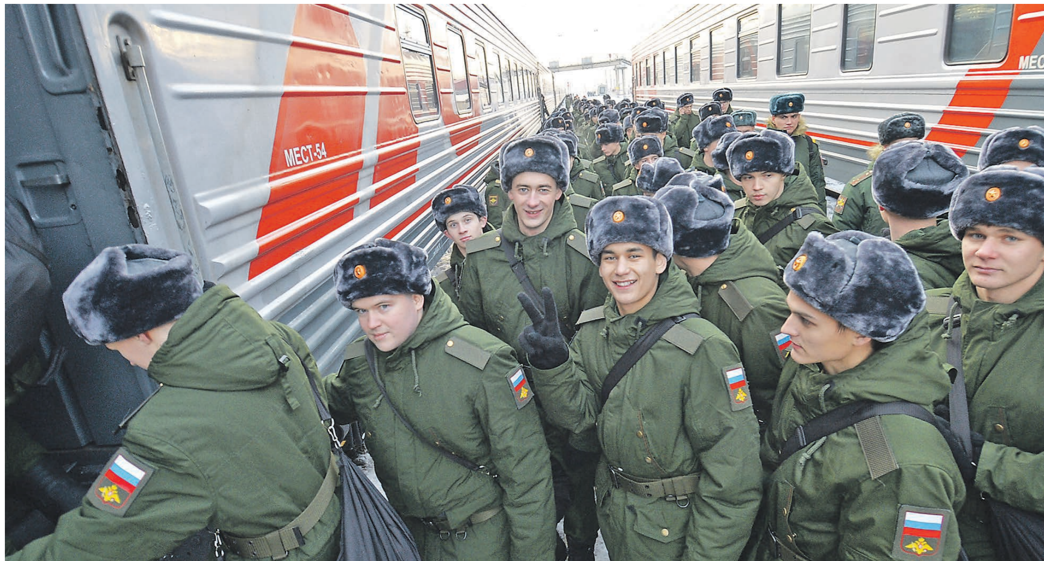
Для тех, кто ждет повестку в армию, виды отсрочек и причины освобождения от призыва, советы, как обжаловать решение медкомиссии, куда обратиться за помощью – на сайте oblgazeta.ru

С первого апреля начинается весенний призыв в армию