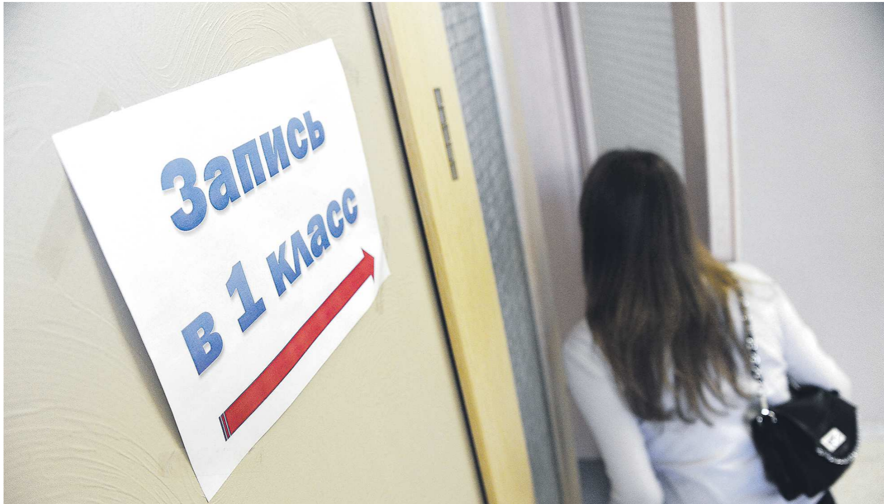
Подать заявление в 1-й класс можно несколькими способами, в том числе при личном обращении в школу

— У меня это старший ребёнок, я впервые подаю заявление в школу, поэтому, конечно, приняла участие в онлайн-тестировании сервиса.