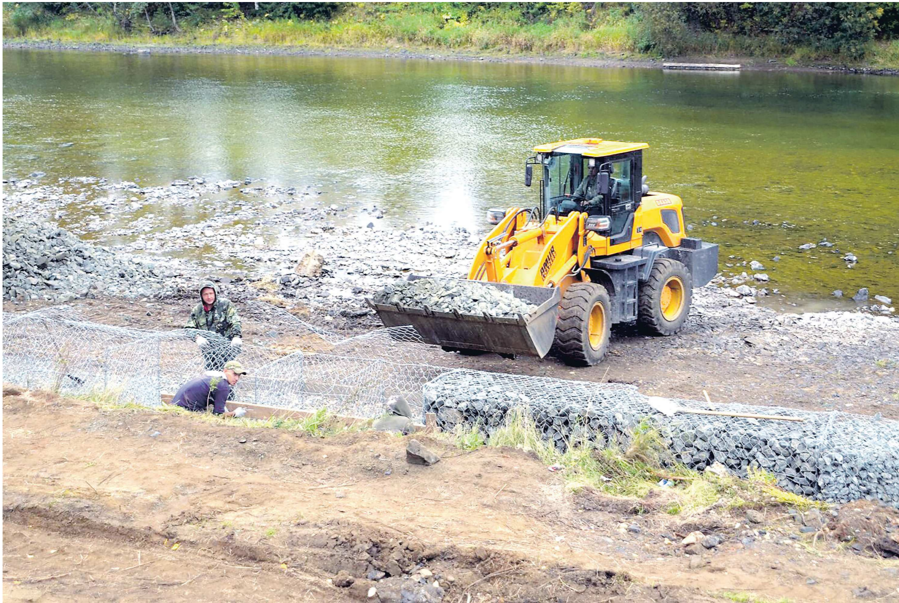
В Ивделе строители укрепляют берег набережной, высота подпорной стенки достигнет двух метров

Несколько проектов в этом году будут реализованы в ивдельских сёлах и посёлках. Жители посёлков Бурмантово, Хорпия и Шипичный, которые часто остаются без света, ждут ремонта изношенной линии электропередачи.