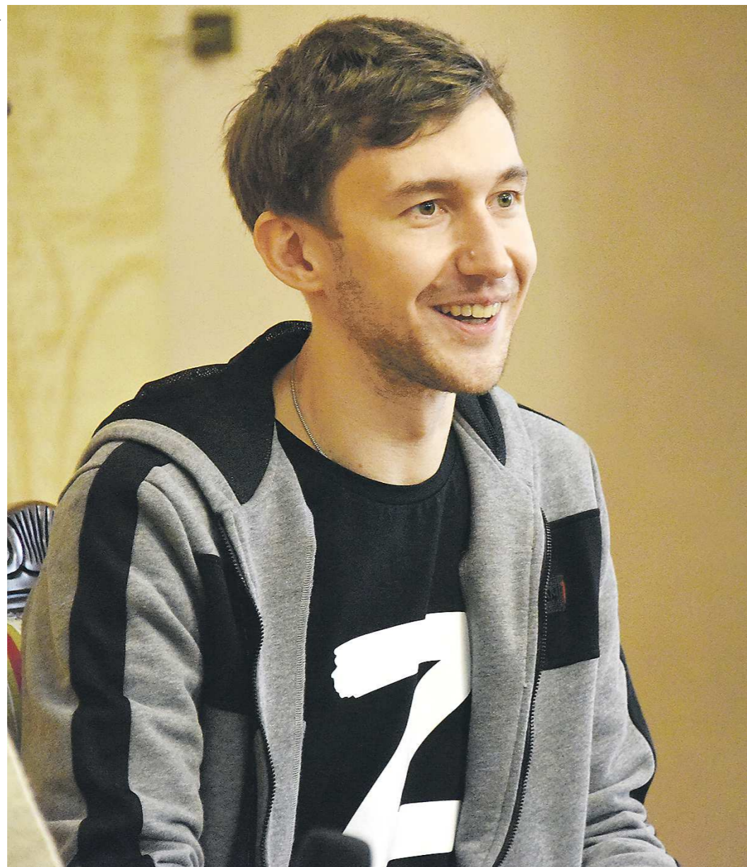
Сергей Карякин считает решение FIDE о своей дисквалификации политическим