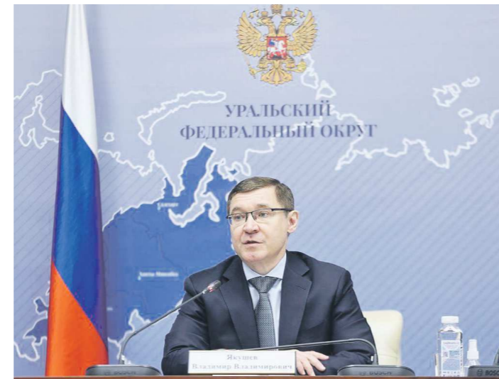
Полпред Владимир Якушев провел Совет губернаторов УрФО в режиме онлайн

его заместители, руководители отраслевых министерств и территориальных подразделений федеральных ведомств и т. д. Сформированы и функционируют рабочие группы по развитию отраслей экономики региона.