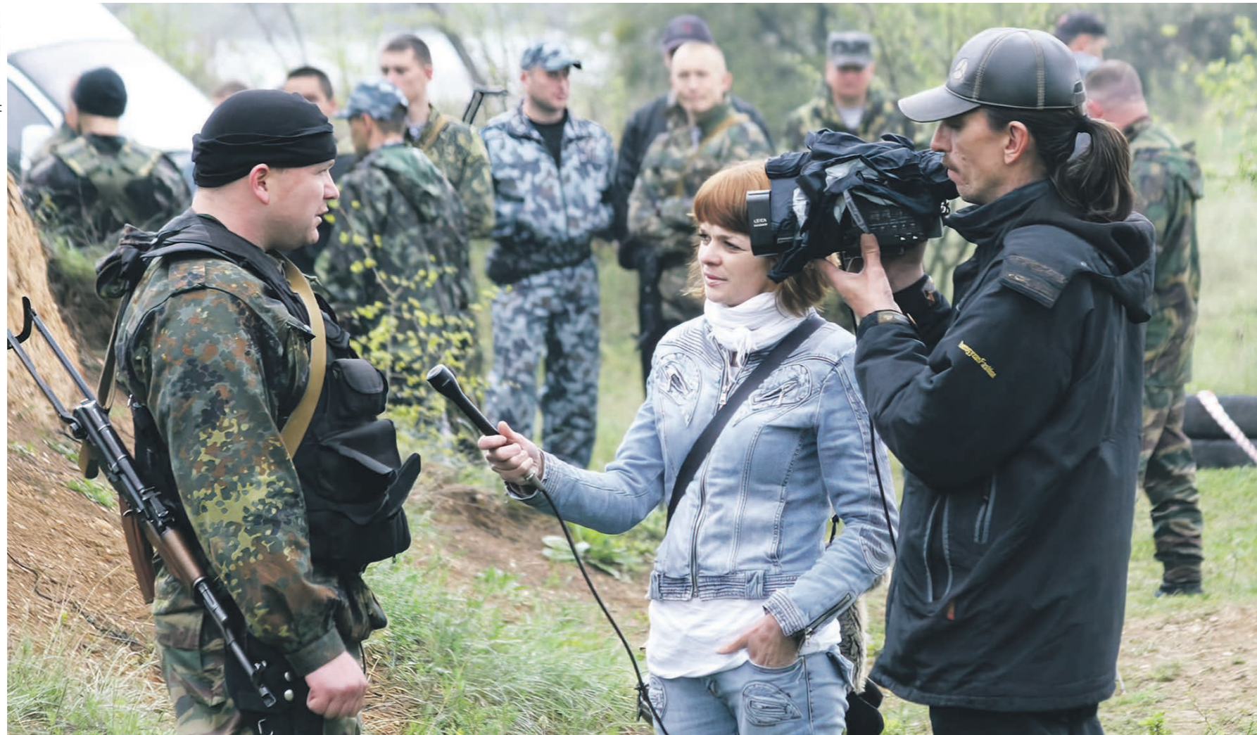
Квалификационные испытания на право ношения крапового берета, г. Симферополь, 2011 год

Когда в феврале 2014 года сотрудники Внутренних войск и спецподразделения «Беркут» вернулись домой из Киева,