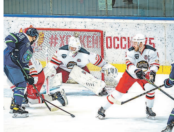
Три встречи серии между «Горняком» и «Югрой» завершились в овертайме

Хоккейный клуб «Горняк-УГМК» не сумел пробиться в полуфинал Высшей хоккейной лиги. В четвертьфинале турнира в серии до четырёх побед верхнегоштырьцы уступили действующему чемпиону – «Югре».