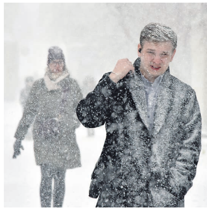
На короткое время снег валит так густо, что едва угадывались ближайшие дома и прохожие