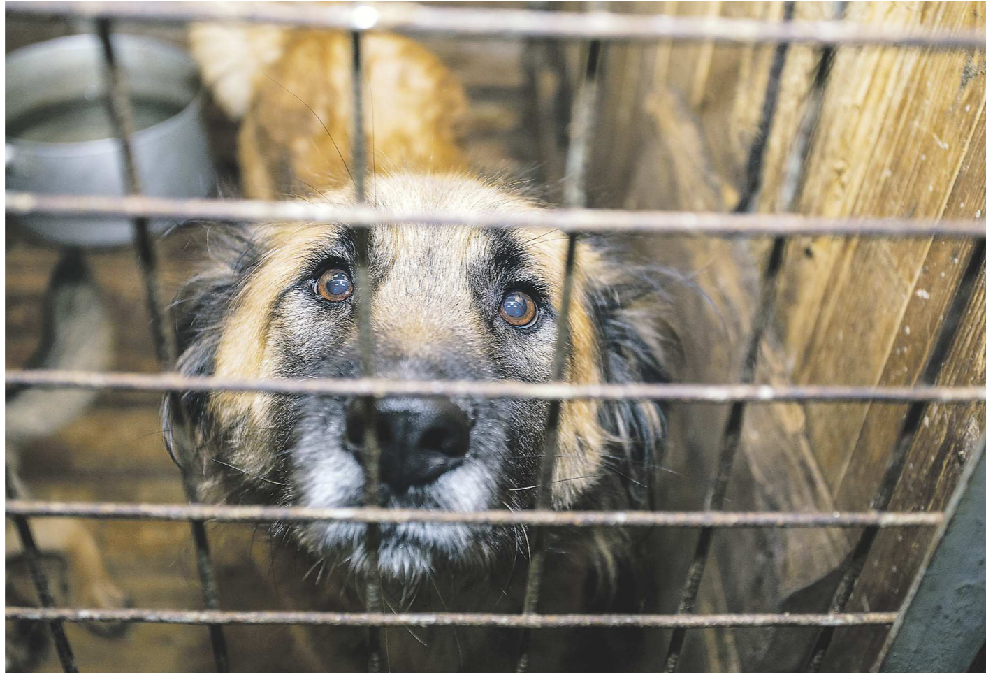
Смогут ли облегчить друг другу жизнь товарищи по неволе — заключённые и бездомные собаки...

Предложение создавать приюты для безнадзорных собак в пенитенциарных учреждениях прозвучало на последнем заседании комитета по аграрной политике и земельным отношениям Законодательного собрания Свердловской области.