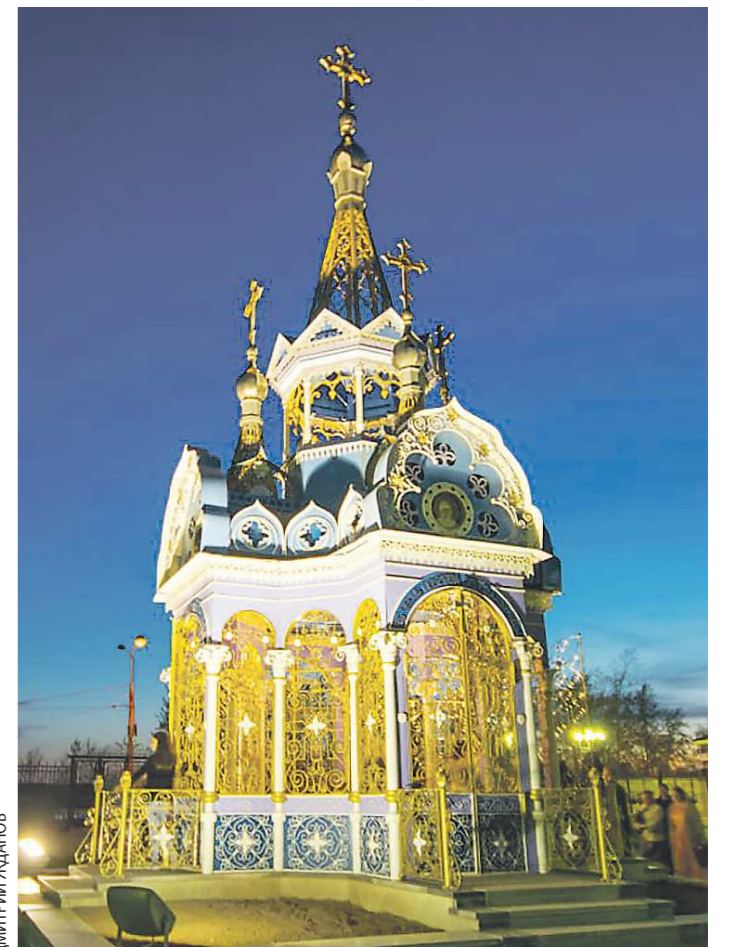
Спасо-Преображенская часовня в Полевском стала одним из любимых мест для горожан. В дни бракосочетаний приезжают к ней молодожёны. Пары верят, что их брак, как бы освятённый этим местом, будет таким же крепким, как стены этого сооружения.