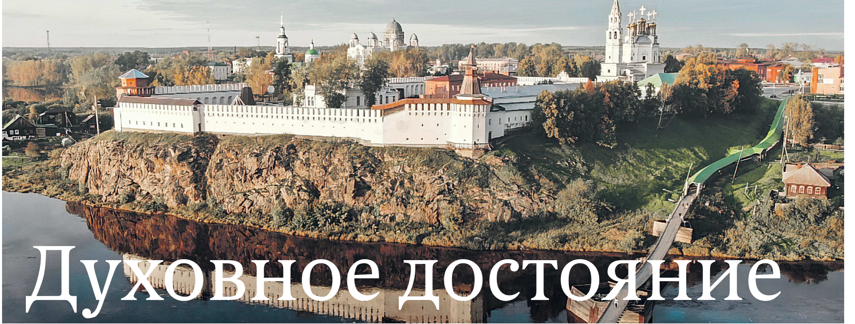
ВЕРХОТУРСКИЙ ГОСУДАРСТВЕННЫЙ ИСТОРИКО-АРХИТЕКТУРНЫЙ МУЗЕЙ-ЗАПОВЕДНИК