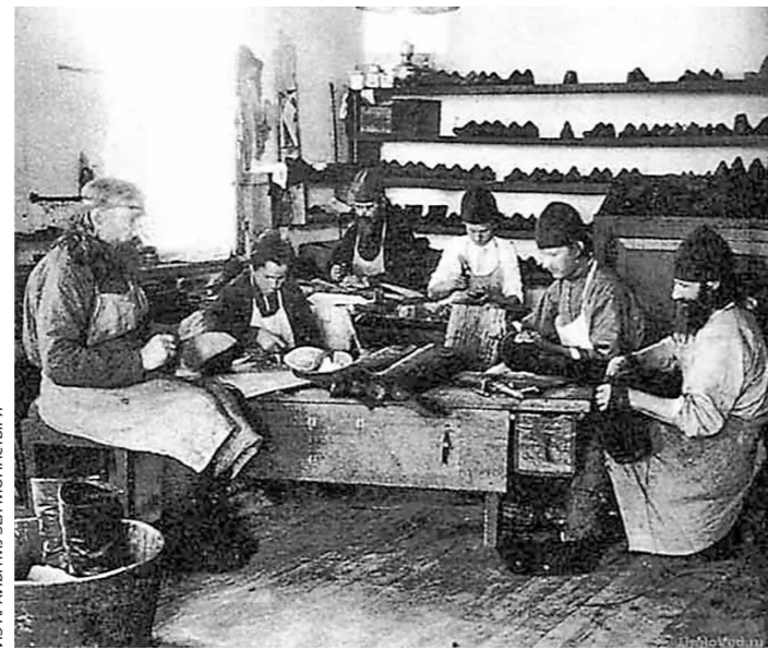
Спожная мастерская в монастыре