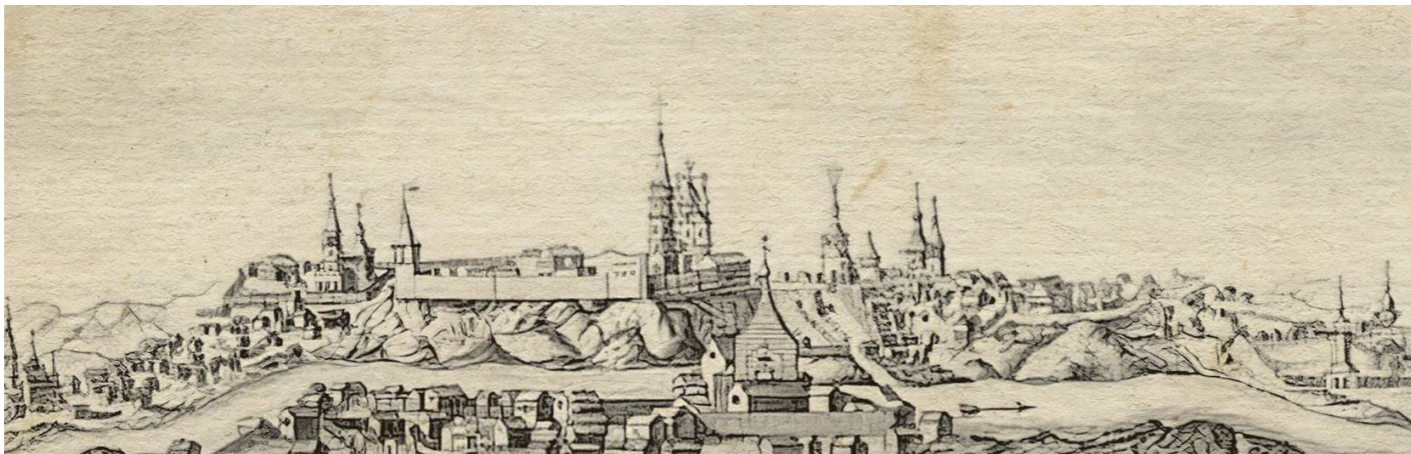
Вид на Верхотурье. Гравюра XVI века