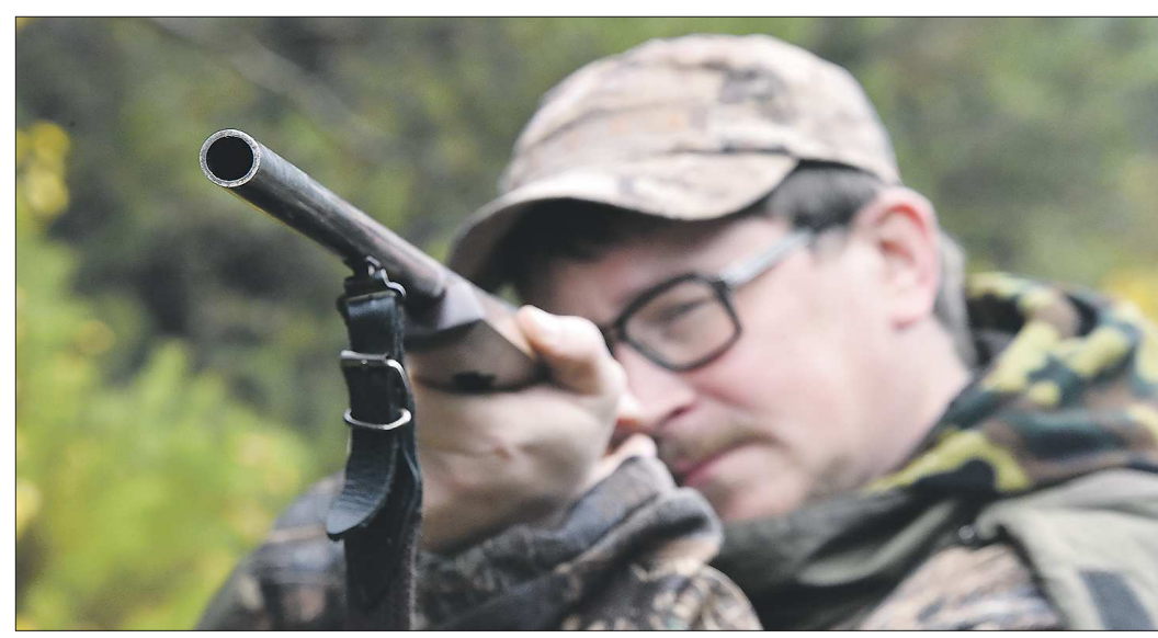
Находиться с ружьём в охотничьих угодьях можно только с разрешением

Специалисты предупреждают охотников о неукоснительном соблюдении правил охоты. Без разрешения нельзя находиться в охотничьих угодьях с охотничьим оружием, в том числе зачехлённым, разобраным, незаряженным. Перевозить добытую дичь можно, имея на руках соответствующее разрешение.