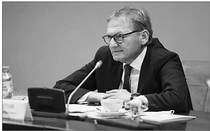
«Радуется, что власти и в целом в стране, и в регионах весьма гибко подходят к вопросу санитарных ограничений, не стремясь к новым локдаунам. Для предпринимателей главное — это отсутствие карантина. Постепенно из кризиса выбираемся. Поддержка оказала позитивное воздействие на сохранение МСП, но проблемы остаются. Опросы предпринимателей показывают меньший оптимизм, чем официальная статистика.»

(из Послания Президента Российской Федерации В.В. Путина Федеральному Собранию, 21 апреля 2021 года) 1