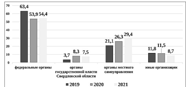
Рисунок 2. Количество жалоб в 2019–2021 годах по органам власти и организациям (%)

Отмечаем некоторое увеличение количества жалоб на органы местного самоуправления: