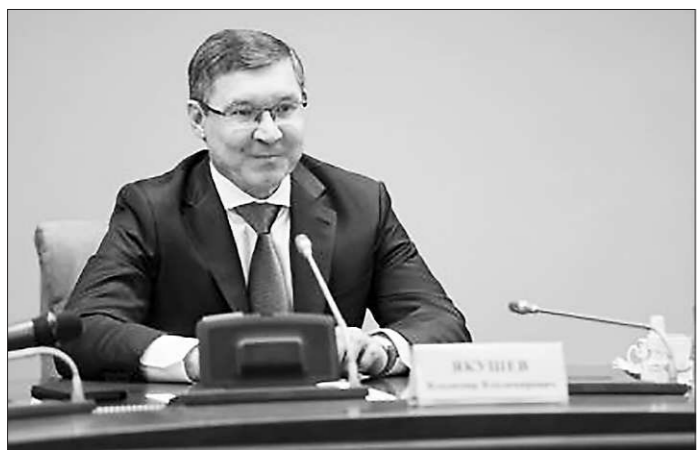
«Мы отслеживаем влияние мер господдержки на рынок. Главное, чтобы не произошло уменьшение числа субъектов МСП. Потому что некоторое их количество все же меняет профиль или уходит с рынка.»

Рабочая встреча Уполномоченного при Президенте Российской Федерации по защите прав предпринимателей Б.Ю. Титова и полномочного представителя Президента Российской Федерации в Уральском федеральном округе В.В. Якушева (7 декабря 2021 года, г. Екатеринбург) 2