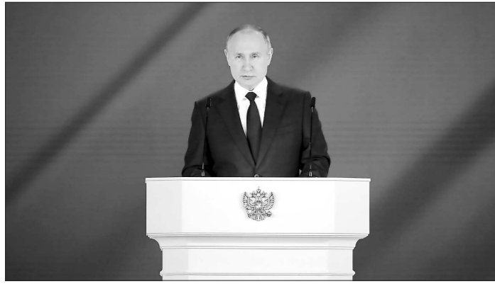
«...талант предпринимателя — это в первую очередь талант создателя, стремление менять жизнь к лучшему вокруг себя, создавать новые рабочие места. Такой настрой государство обязательно будет поддерживать.»

(из Послания Президента Российской Федерации В.В. Путина Федеральному Собранию, 21 апреля 2021 года) 1