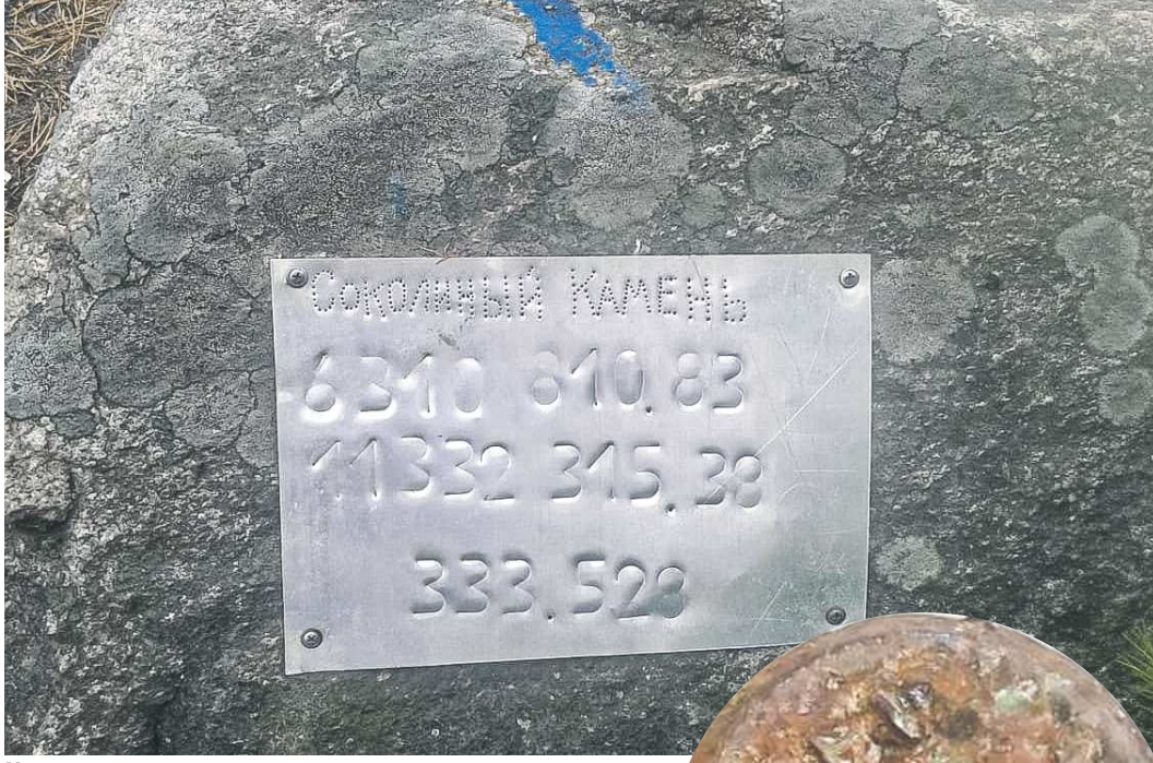
На геопункте указывают координаты и название

Сеть геодезических пунктов обширна. Она позволяет определять координаты больших сельскохозяйственных и небольших населённых пунктов, улиц... Каждый геодезический пункт закрепляет точку земной поверхности с определёнными координатами, основываясь на кото-