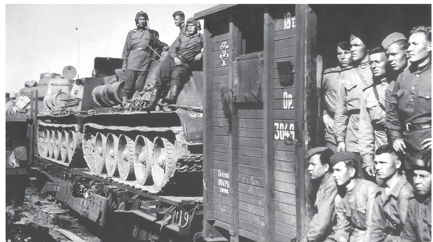
Уральские танкисты отправляются на фронт. Эшелонам был организован «зелёный коридор»