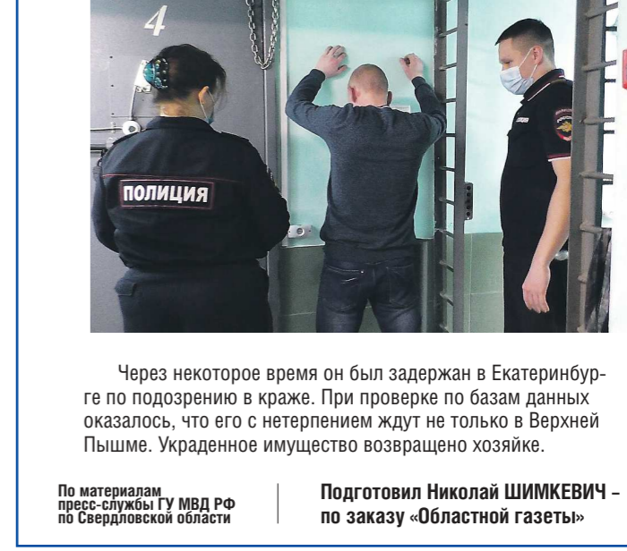
По материалам пресс-службы ГУ МВД РФ по Свердловской области. Подготовил Николай ШИМКЕВИЧ - по заказу «Областной газеты»

Задержанный верхнепышминской полицией аферист оказался в федеральном розыске. Житель другого региона, обвиняемый там в краже, скрывался от следствия на территории Свердловской области, продолжая работу «по профилю». Зарегистрировавшись на сайте знакомств, мужчина знакомился с дамами. В январе текущего года очередной его виртуальной подружкой стала девушка из Верхней Пышмы. Через месяц общения девушка, стопроцентно доверявшая новому другу, предложила перебраться к ней: молодой человек был вежлив и обходителен, а наметанным глазом следователя бабырыша не обладала, поэтому её ничто не тревожило. Ещё через две недели мужчина, проводив свои изобретения на работу, решил, что уже пора выбрать из её вещей что-нибудь подходящее для себя и двинуться дальше. В итоге его добычей стали ноутбук и золотые украшения, которые он отвёз в Екатеринбург, где и сбыл. Поскольку он был джентльменом, то из вырванных средств купил своей даме букет цветов. Вернувшись в Пышму, заехал к любимой женщине, вручил букет, поздравил с Днём святого Валентина - и после этого уехал, окончательно перестав отвечать на звонки.