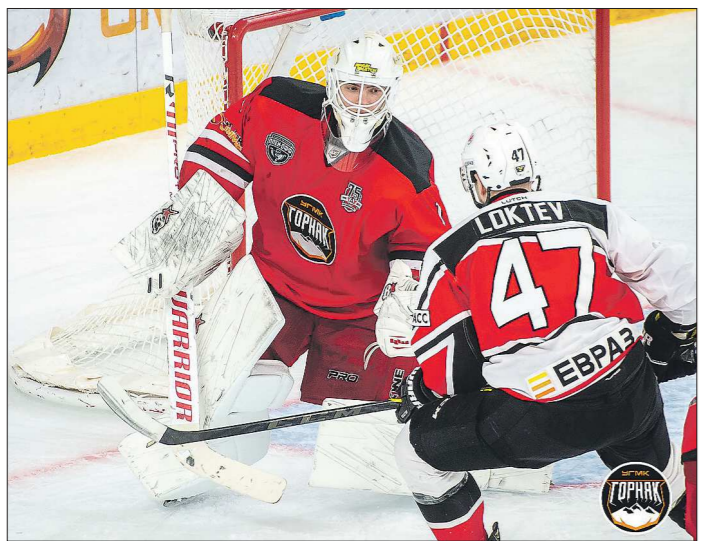
Хоккеисты УГМК обыграли «ЕВРАЗ»