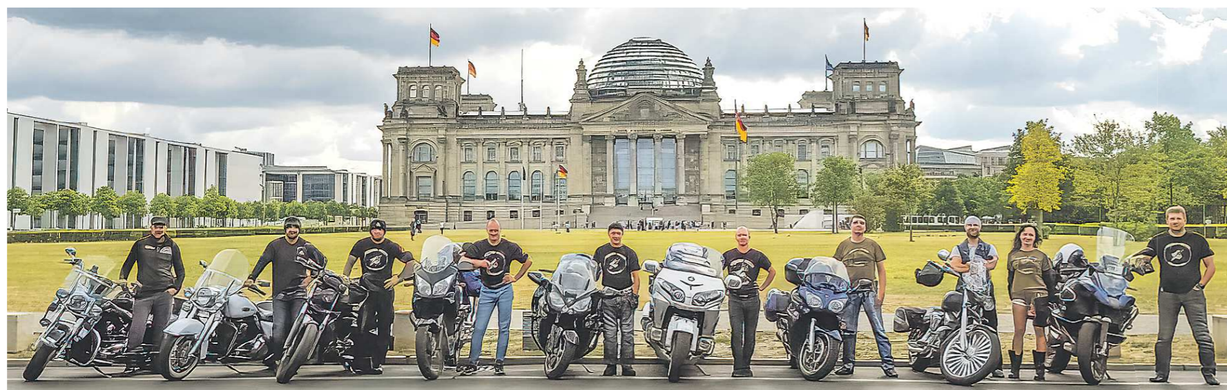
В 2018 году уральские байкеры прошли весь маршрут УДТК. Из Екатеринбурга на мотоциклах доехали до Берлина, по дороге посетили города, где проходили бои

Чёрный нож – это народное название армейского ножа образца 1941 года. Их выпускали на Златоустовском инструментальном комбинате. Деревянные рукоятку и ножны покрывали чёрным лаком – отсюда и название клинка