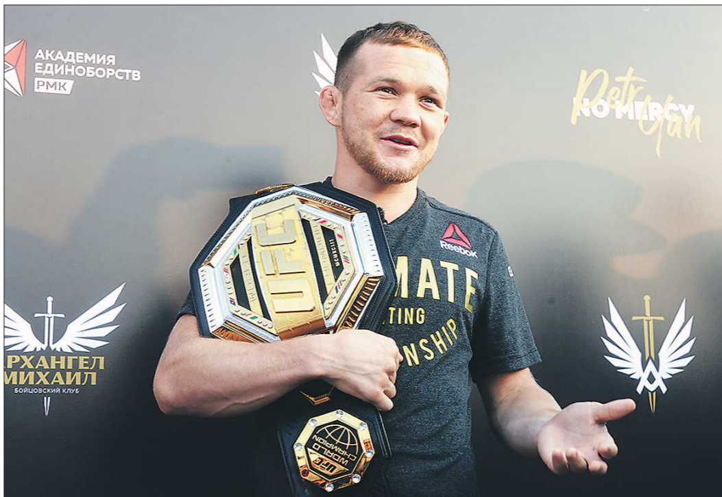
Пётр Ян стал чемпионом UFC в июле 2020 года, в марте прошлого года потерял свой пояс, а в октябре завоевал титул временного чемпиона

В ночь с 9 на 10 апреля во Флориде (США) пройдёт турнир по смешанным единоборствам UFC 273. В одном из главных боёв вечера выступит уральский боец Пётр Ян, которого ожидает титульный поединок против американца Алджамейна Стерлинга в легчайшей весовой категории (до 61,2 кг). Однако из-за политической обстановки в мире в последнее время многие российские спортсмены были отстранены от международных соревнований, и остаются вопросы: сможет ли Пётр Ян провести бой на территории США и сможет ли решить эту проблему такая крупная коммерческая организация, как UFC.