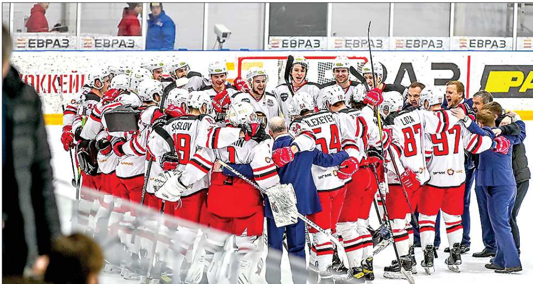
«Горняк-УГМК» во второй раз подряд пробился в четвертьфинал Высшей хоккейной лиги

Верхнепышминцы заняли 12-е место в регулярном чемпионате и в играх на вылет встречались с новокузнецким «Металлургом», который финишировал пятым в регулярном чемпионате. В первом матче серии новокузнецкие хоккеисты сыграли как и полагается лидеру: в первых двух периодах «Металлург» забросил четыре безответные шайбы, а победу одержал со счётом 6:2. Однако уже во второй игре в серии, которая также проходила в Новокузнецке, «Горняк-УГМК» сумел реабилитироваться в глазах своих болельщиков. Матч получился напряжённым, по ходу встречи свердловские хоккеисты вели со счётом 3:1, но