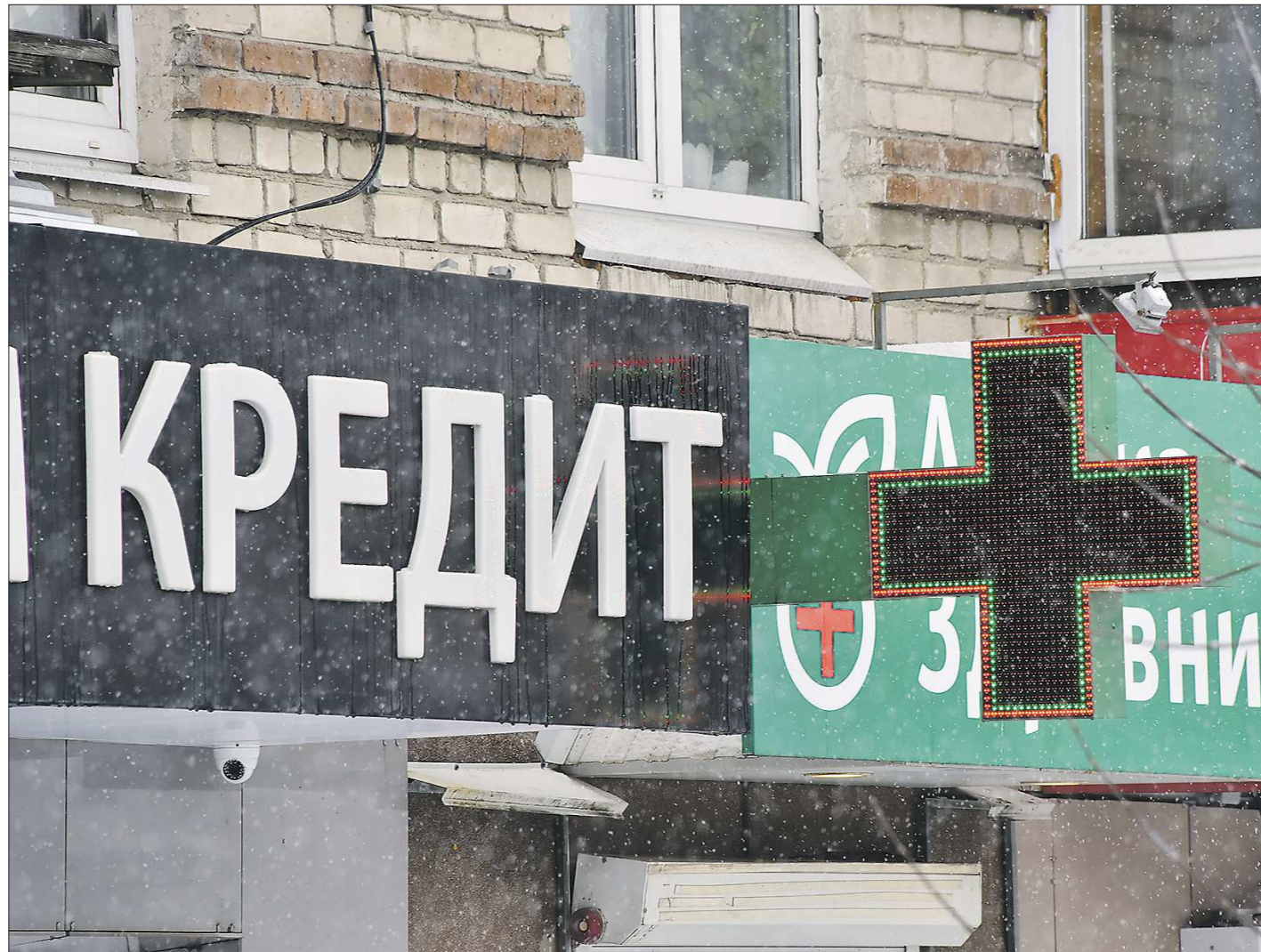
За минувший год россияне приплюсовали к своим долгам по наличным и ипотечным кредитам 12,5 триллиона рублей