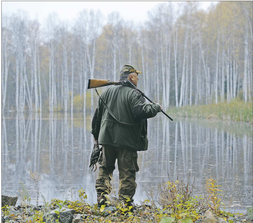
Подвляющая часть владельцев огнестрельного оружия – это охотники

Отныне оружиевую комиссию можно будет пройти только в государственных или муниципальных медицинских организациях. В частных поликлиниках этого сделать нельзя. Если у человека нет противопоказаний для владения оружием, будет оформлено электронное заключение и его внесут в федеральный реестр документов Единой государственной информационной системы в сфере здравоохранения. Оттуда информация автоматически передаст в Росгвардию, которая выдаёт лицензию на приобретение огнестрельного оружия. Заключение будет действительно один год с момента его оформления: по