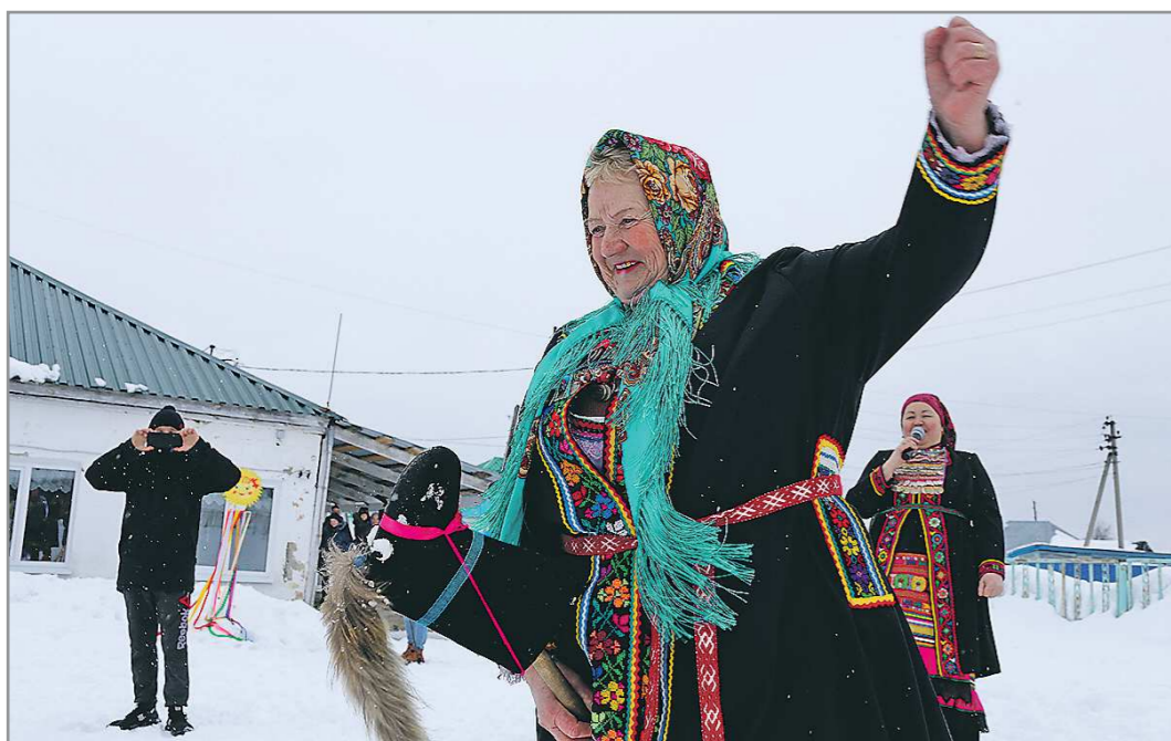
По случаю праздника в деревне устроили конные скачки: «рысаков» смастерили из мётел и валенок