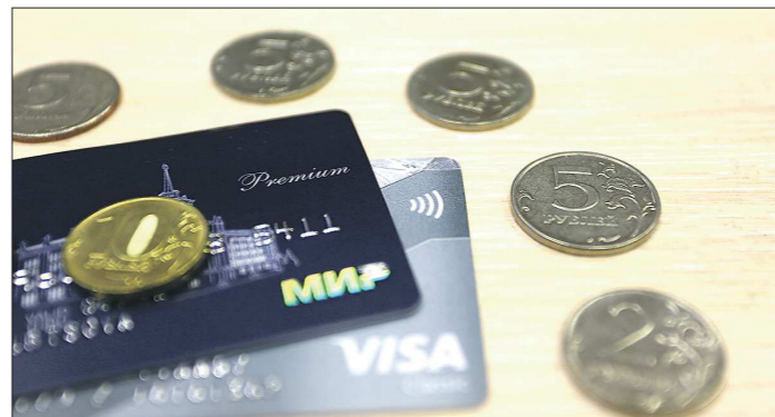
Эксперты уверены, что за платёжной системой «МИР» в России – будущее

«В России все эти карты как действовали, так и будут действовать, так как внутри страны платежи обрабатываются