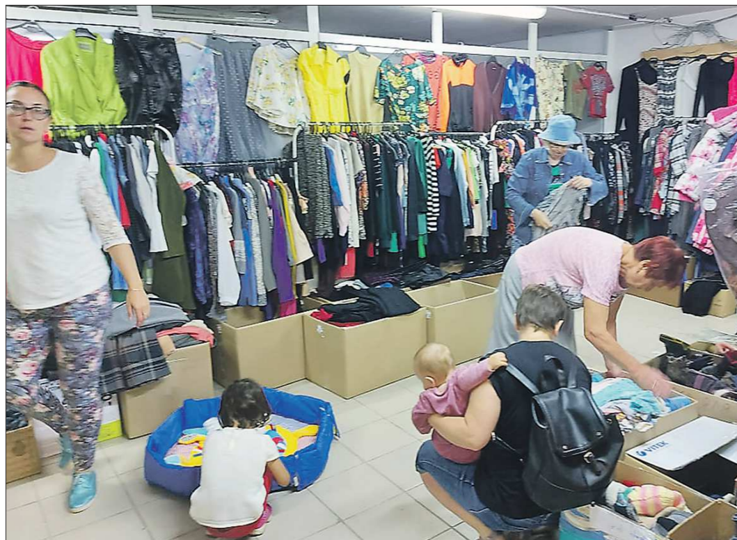
Одежду можно выбрать на любой возраст и пол

Первые контейнеры, купленные на грантовые деньги, в Берёзовском установили в июне 2021 года. За полгода проект «Нужные вещи» набрал силы, и пункты сбора вещей выросли в магазин. Отovarиваться здесь можно два раза в неделю, в остальные дни со-