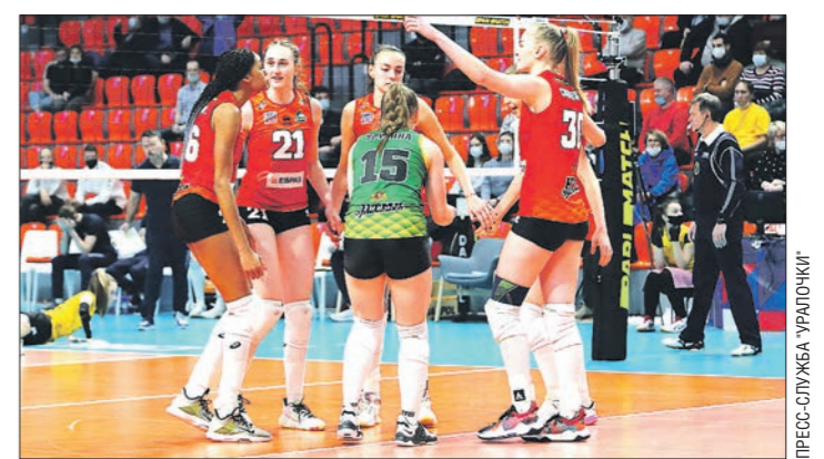
«Уралочка» сумела переломить ход встречи с «Енисеем», уступая 0:2 по партиям

Но «Уралочке» всё же удалось вернуться в игру. Если третий сет прошёл в упорной борьбе и завершился со счётом 25:22 в пользу команды Михаила Карполя, то в четвёртом сете свердловские волейболистки были намного лучше своих соперниц. Хорошо работали в атаке практически не было ошибок, поэтому «Уралочка» сумела победить с раз-