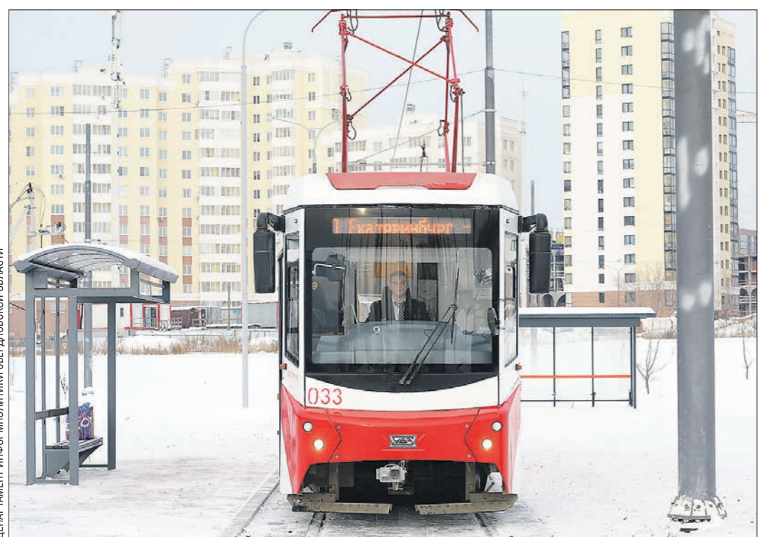
Первый трамвай на линии до Верхней Пышмы уральцы увидели перед Новым годом