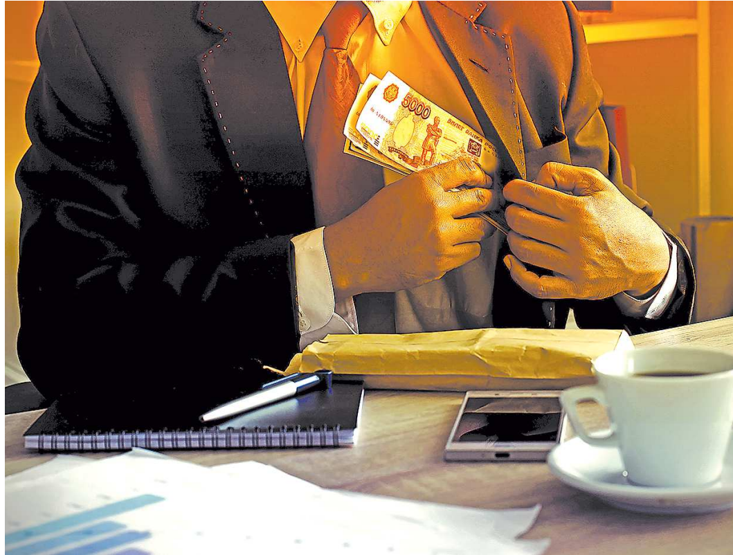
Эксперты советуют: прежде чем заплатить деньги, внимательно прочтите договор