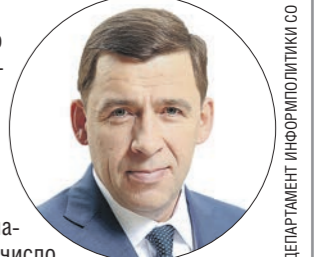
ДЕПАРТАМЕНТ ИНФОРМАТИКИ СО

Губернатор Свердловской области Евгений КУЙВАШЕВ