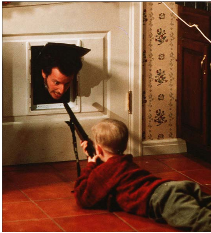
Принцип «Мой дом – моя крепость» наиболее последовательно применяется в Америке (на снимке – кадр из фильма «Один дома»)

И тем не менее ныне действующая норма не всегда позволяет избежать уголовной ответственности тому, кто дал жёсткий отпор преступнику. Зачастую люди, пытающиеся отстоять свою жизнь, предстают перед судом по обвинению