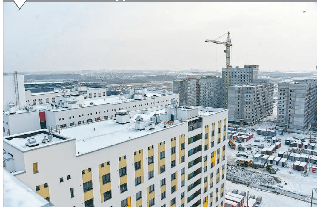
Корреспонденты «Облазеты» побывали на строительстве объектов деревни Универсиады-2023, где идёт работа над Дворцом водных видов спорта, а также пятью комплексами общежитий (на фото), часть из которых обещают сдать уже в этом году