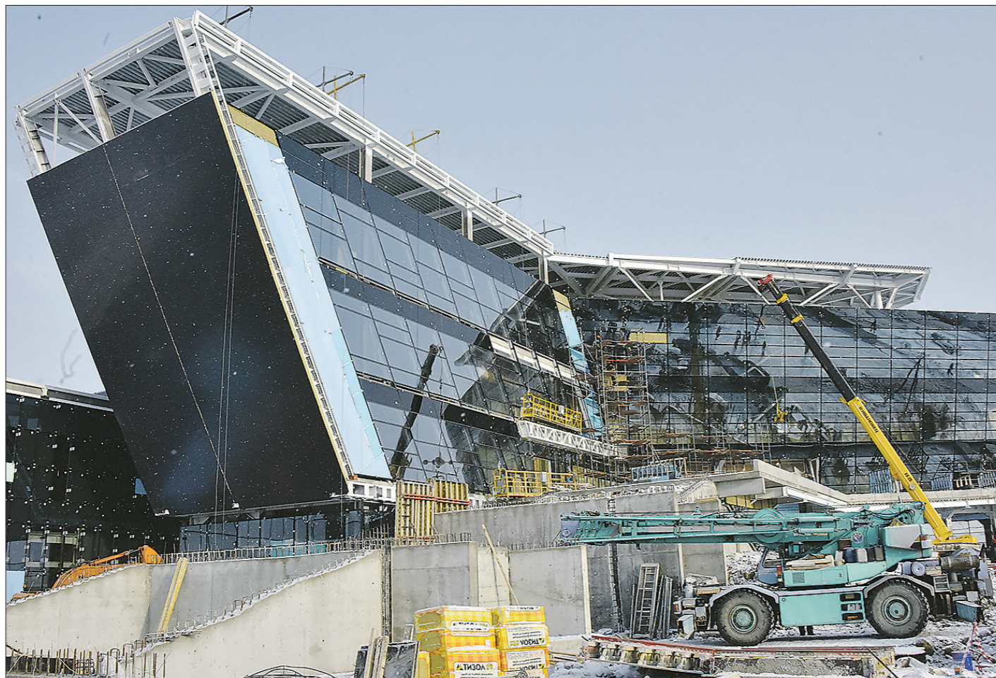
Продолжается работа по установке фасадных конструкций Дворца водных видов спорта. Монтаж панелей по правой стороне завершён, а по левой выполнен на 98 процентов. Ведутся работы по остеклению

В последний, к слову, пустили впервые. Он будет предназначаться для решения организационных задач и для обслуживания делегаций. Главная его часть – манеж-трансформер, который во время Универсиады станет фудкортом, а уже по-