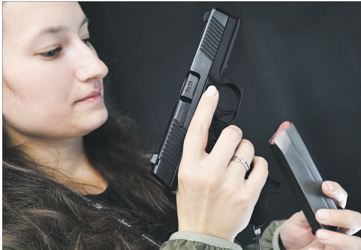
Иметь оружие россиянам можно. Но применять его для собственной защиты – рискованно: суды часто квалифицируют стрельбу по преступнику как превышение необходимой обороны