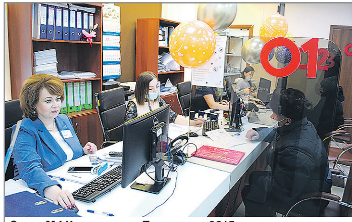
Отдел МФЦ появился в Тугулыме в 2015 году