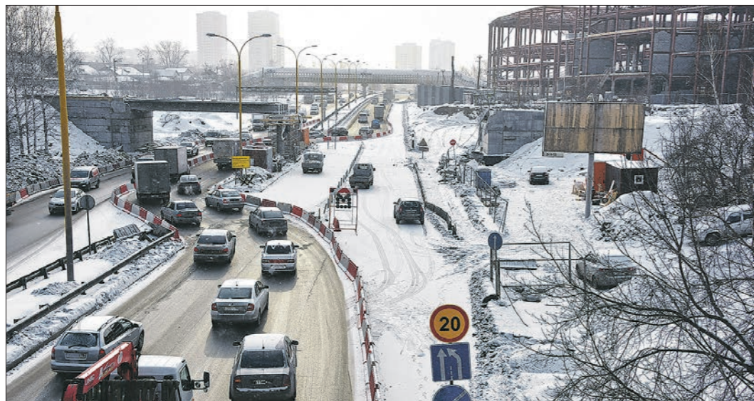
Серьёзные дорожные заторы на Объездной дороге наблюдались в начале минувшей недели. В итоге дорожники пересмотрели график работ. Было решено полностью открывать движение по утрам

Как сообщил «Областной газете» пресс-секретарь «Машева, 73» Илья Ключин, чтобы избежать сильных заторов в утренние часы пик, все дорожные знаки убираются, движение полностью открывается. Проехать спокойно можно до 10:00. А вот тем, кто не успел, придётся стоять в пробке. По данным сервиса «Яндекс.Карты», в зависимости от времени суток