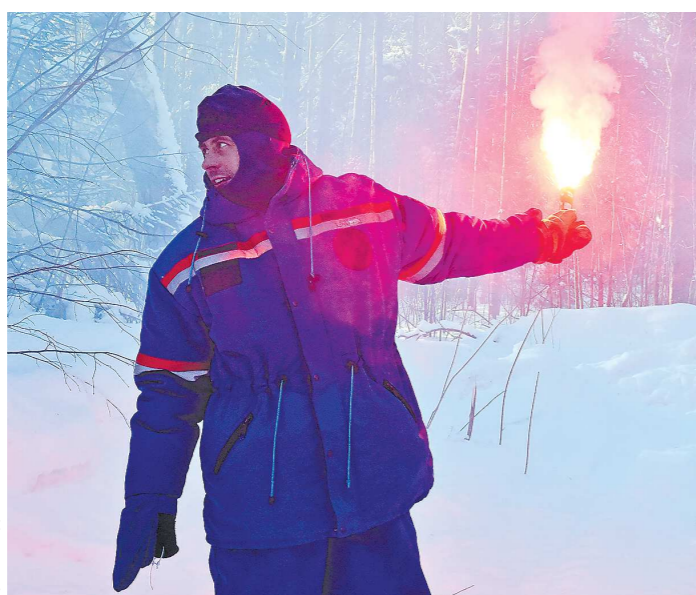
Сигнал условному вертолету о местонахождении космонавтов во время тренировки по выживанию зимой в лесисто-болотистой местности

на МКС – космическая лаборатория. Но чтобы это делать, надо ее обслуживать, поэтому космонавт выступает не только в роли ученого, исследователя, он также должен уметь выполнять необходимые работы для поддержания работоспособности станции.