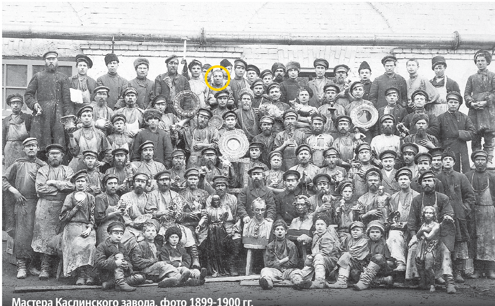
Мастера Каслинского завода, фото 1899-1900 гг.