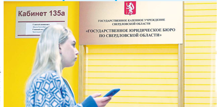
В офисе на Малышева, 101 люди приходят за помощью

В соответствии со статьей 131 Гражданского кодекса Российской Федерации (далее – ГК РФ) право собственности и другие вещные права на недвижимость возникают по распоряжению, ограничению этих прав, их возникновению, переходу и прекращению подлежат государственной регистрации в Едином государственном реестре.