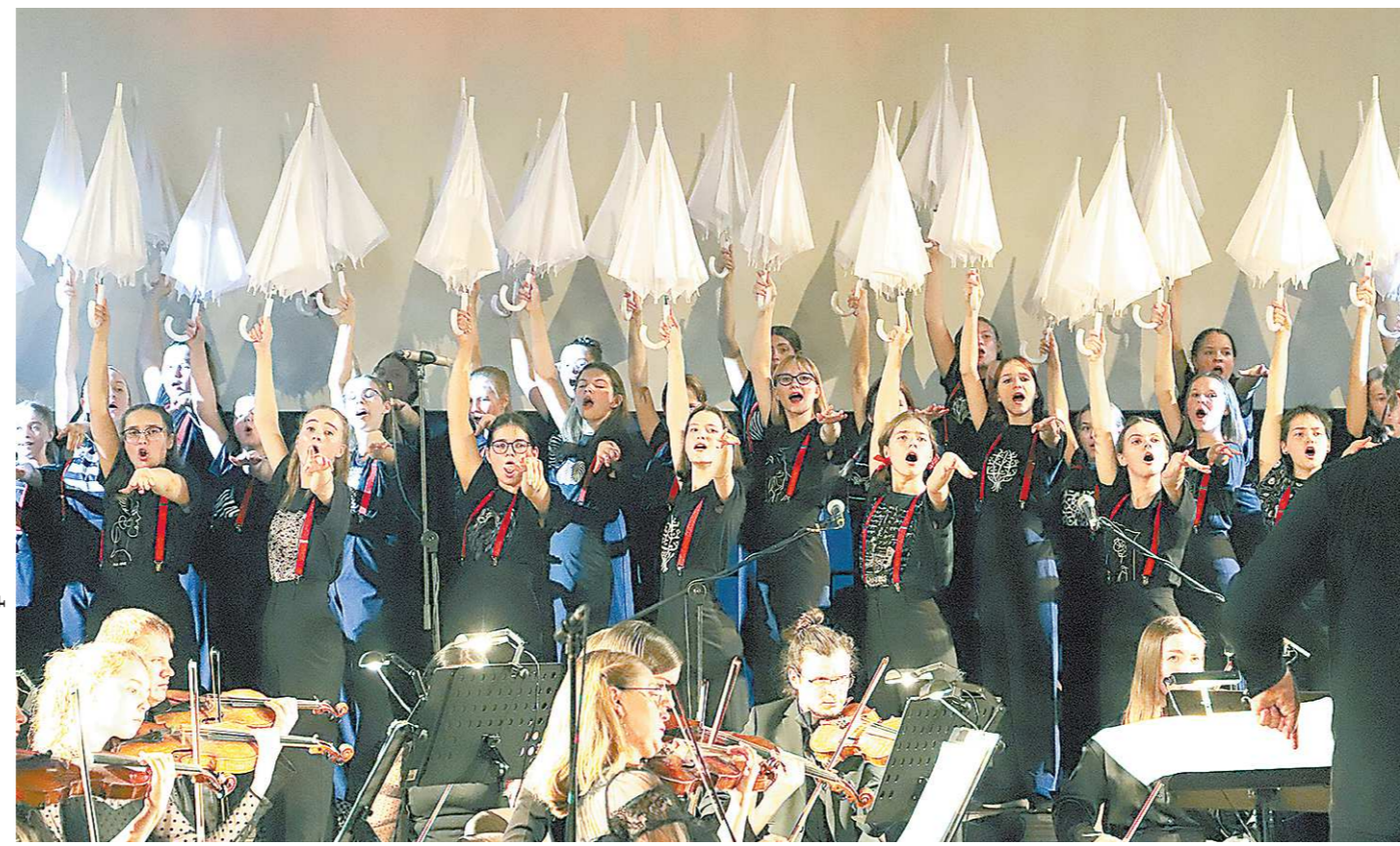
Дыхание Земли – нерв «Адиемуса», особенно остро оно ощущалось в сцене с «дышащими» зонтиками, отстукивающими пульс планеты