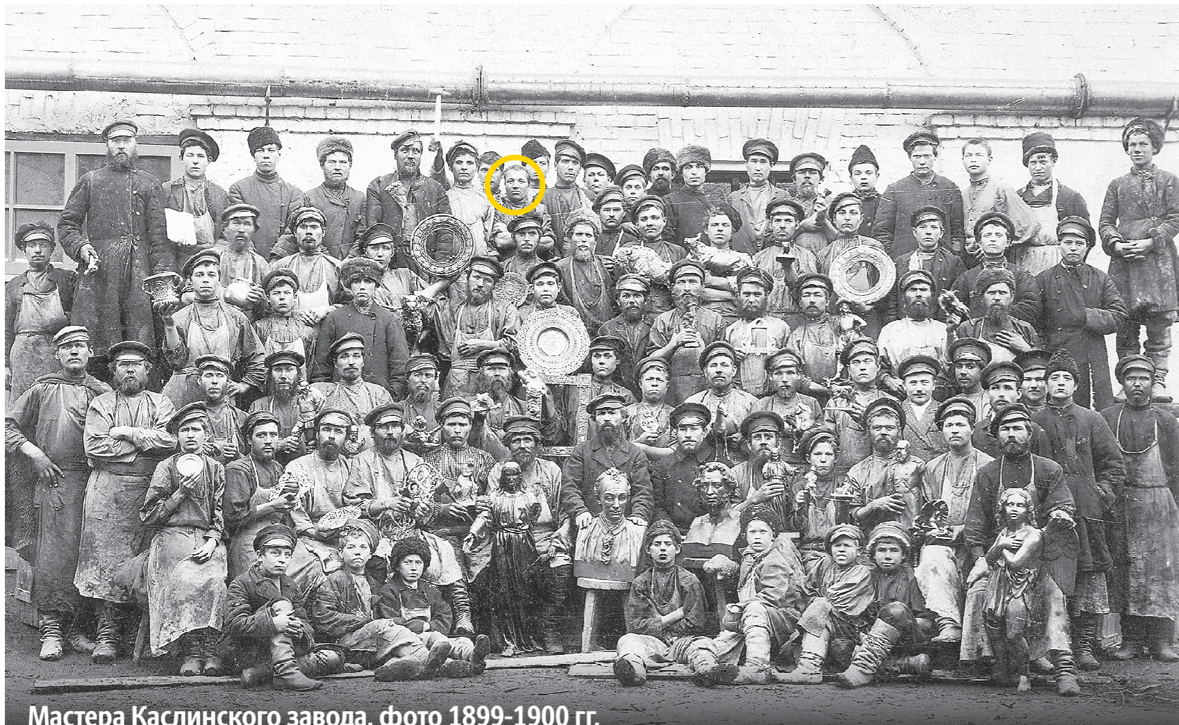
Мастера Каслинского завода, фото 1899-1900 гг.