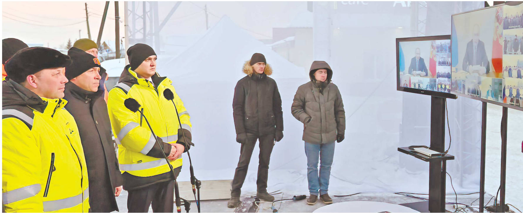
Евгений Куйвашев (на фото слева в центре) вместе с дорожными строителями принял участие в торжественной церемонии открытия участка трассы Р-351 в режиме онлайн

По трассе проедут маршруты по грузоперевозкам и пассажиропотокам. Хочу поблагодарить рабочих, которые участвовали в реализации этого проекта, а их более 350 человек. А также – Министерство транспорта и Росавтодор за то, что отрасли уделяется большое внимание,