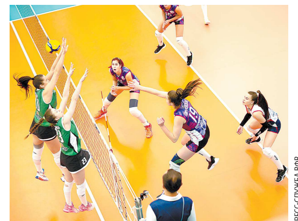
«Уралочка» проиграла в Красноярске впервые с 2018 года

В 11-м туре чемпионата России свердловская «Уралочка-НТМК» на выезде со счетом 0:3 проиграла красноярскому «Енисею». Это уже восьмое поражение нашей команды в нынешнем сезоне и седьмое – сухое.