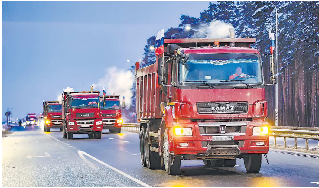
Протяженность нового участка автодороги Екатеринбург–Тюмень составляет 35 километров