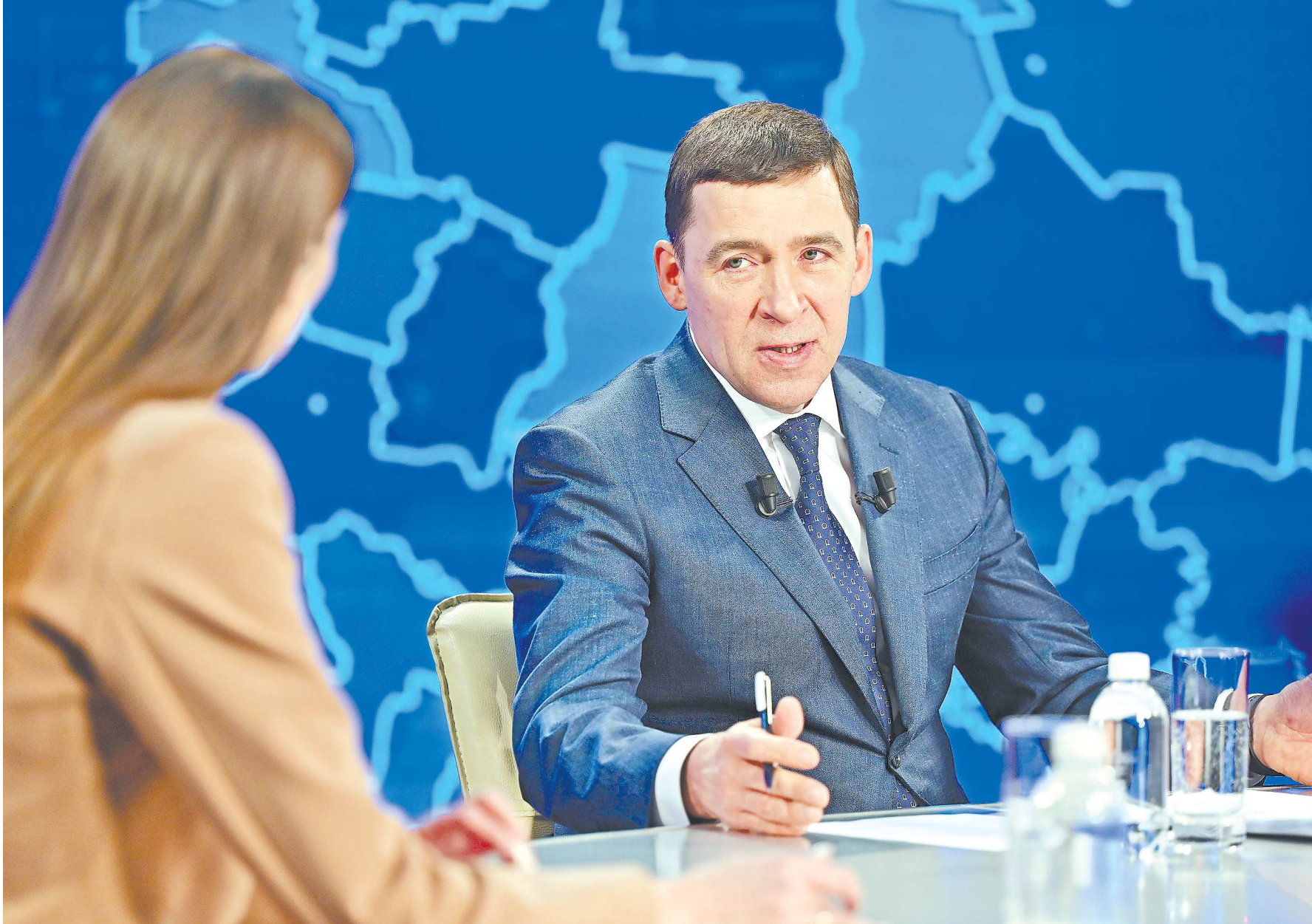
За время прямого эфира Евгений Куйвашев ответил на несколько десятков вопросов свердловчан

— Таких случаев немало, поэтому обращайтесь на горячую линию. Ее операторы, аппарат Уполномоченного по правам человека составляют списки родственников, кто не может связаться с мобилизованными, и передают их в воинские части с просьбой предоставить такую возможность.