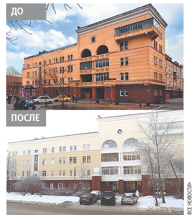
Дом на улице Ильича – до и после ремонта

В Нижнем Тагиле привели в порядок дом-памятник на Вагонке.