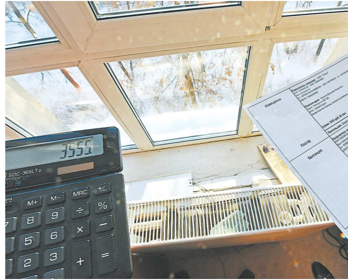
Квитанции с новыми цифрами свердловчане получат в следующем месяце

VK.com/obligazeta OK.ru/obligazeta96 T.me/obligazeta