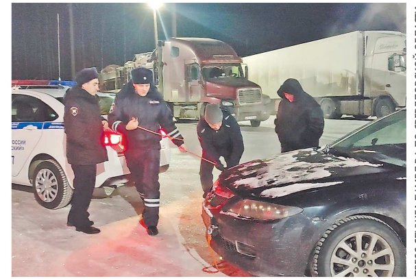
ПРЕСС-СЛУЖБА ГУ МВД РФ ПО СVERДЛОВСКОЙ ОБЛАСТИ

Экипаж ГИБДД оказал помощь семье из Сургутта, попавшей в сложную ситуацию на трассе Ивдель–ХМАО. Учитывая, что за бортом было –30°, можно без преувеличения сказать, что полицейские спасли людей.