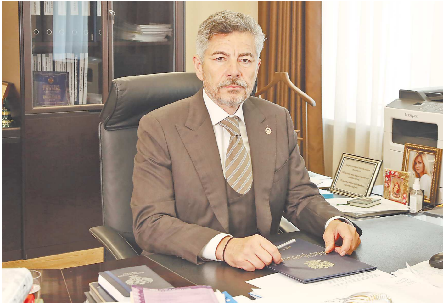
УПРАВЛЕНИЕ ФЕДЕРАЛЬНОГО КАЗНАЧЕЙСТВА ПО СVERДЛОВСКОЙ ОБЛАСТИ

– Текущая финансовая деятельность Управления в структуре Казначейства России связана с решением государственных задач в рамках исполнения бюджетов, бухгалтерского учета и отчетно-