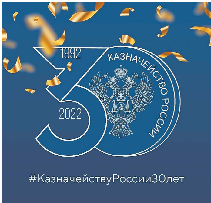
УПРАВЛЕНИЕ ФЕДЕРАЛЬНОГО КАЗНАЧЕЙСТВА ПО СVERДЛОВСКОЙ ОБЛАСТИ

сти, государственного финансового контроля, контрактной системы, аудиторской практики и многих других направлений. Они определяются стратегией бюджетной политики в Свердловской области и Уральском федеральном округе.