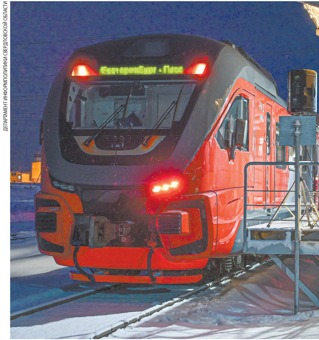
Первым рейсом рельсовый автобус «Орлан» доставил Владимира Якушева, Евгения Куйвашева и других пассажиров из Верхней Пышмы в Екатеринбург