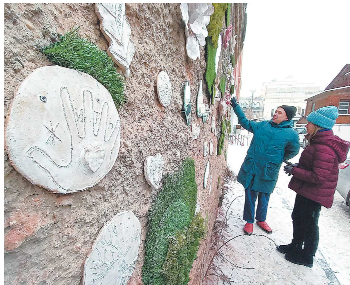
На фото — панно «Навсегда»

Арт-объект ждал своего часа несколько месяцев, и очень символично, что именно 1 декабря, во Всемирный день борьбы со СПИДом, состоялся его презентация. Панно занимает всю стену здания по адресу ул. Розы Люксембург, 14а. — Конечно, место для нашего арт-объекта выбрано не случайно. Рядом находится кожно-венерологический диспан-