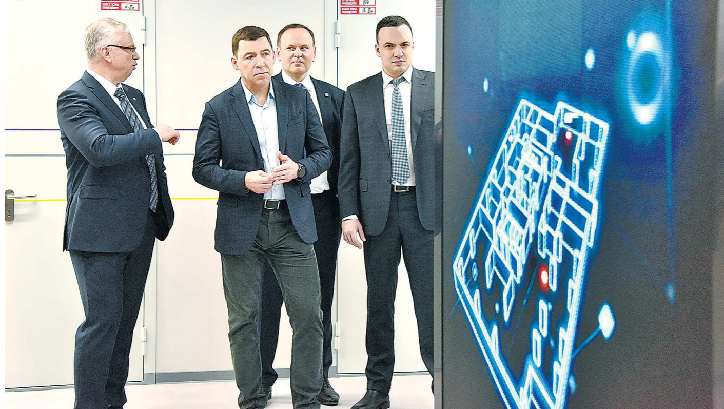
Председатель Уральского банка Сбербанка Дмитрий Суховеров (на фото — слева) знакомит губернатора Свердловской области Евгения Куйвашева (на фото — в центре) и заместителя губернатора Дмитрия Ионина (на фото — справа) с площадками технохаба

Одним из первых с организацией рабочего пространства, где будет создаваться новый цифровой продукт, ознакомила глава региона Евгения Куйвашев. На церемонии открытия технохаба он отметил важность создания но-