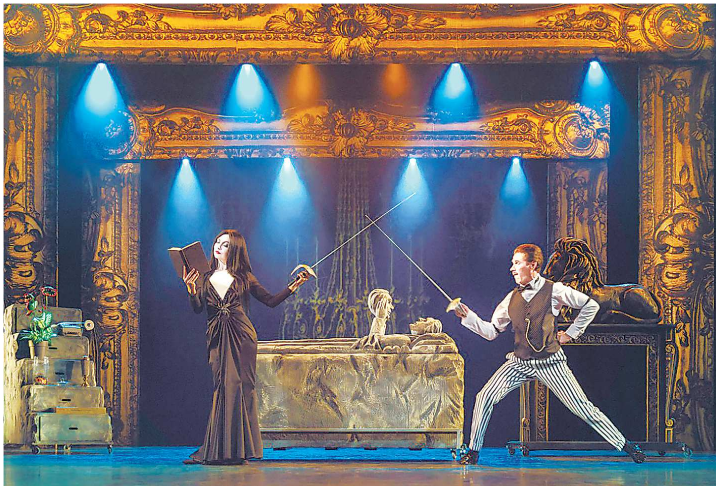
Нашумевший мюзикл «Семейка Аддамс» из Тюмени, получивший рекордные девять номинаций на «Золотой Маске», представлен на фестивале «Музыкальное сердце театра». Но и здесь, на музыкальной ристалище, ему предстоит сразиться с другими фаворитами театральной России

Оба эпитета – ключевые. Насчет «прекрасного» – кто бы спорил. Но чтобы спектакли увидели зрители «Музыкального сердца театра», их нужно привезти на фестиваль. А это дело дорогостоящее: музыкальные спектакли, как правило, масштабны (это вам не два актера и коврик, с чем можно создать драматический спектакль). Все годы истории фестиваля его организаторы, конечно, рассчитывают прежде всего на самих себя. Но как значима поддержка, что пришла недавно: вот уже второй раз фестиваль поддержал Президентский фонд культурных инициатив: в прошлом году выделил 11,5 млн рублей, нынче – около 17 миллионов.