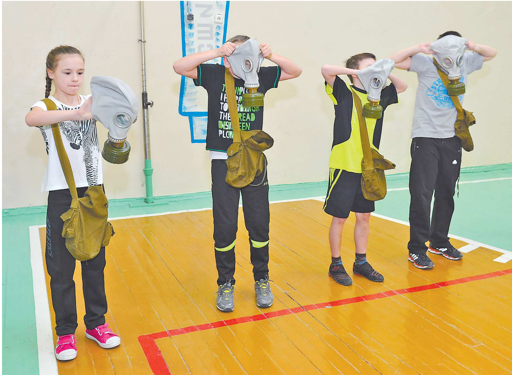
На курсах начальной военной подготовки школьники приобретут много полезных навыков

– Есть проблемы: нехватка учителей и состояние самих школ. Для решения этих