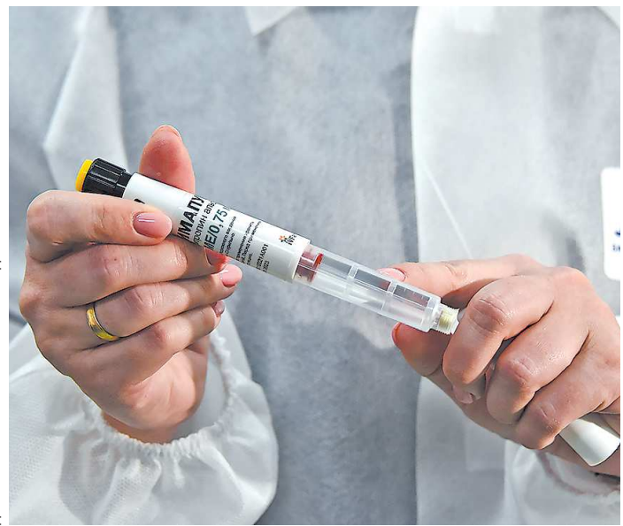
Созданный цех сможет выпускать около миллиона шприц-ручек с препаратом

В Новоуральске начали выпускать препарат для лечения бесплодия