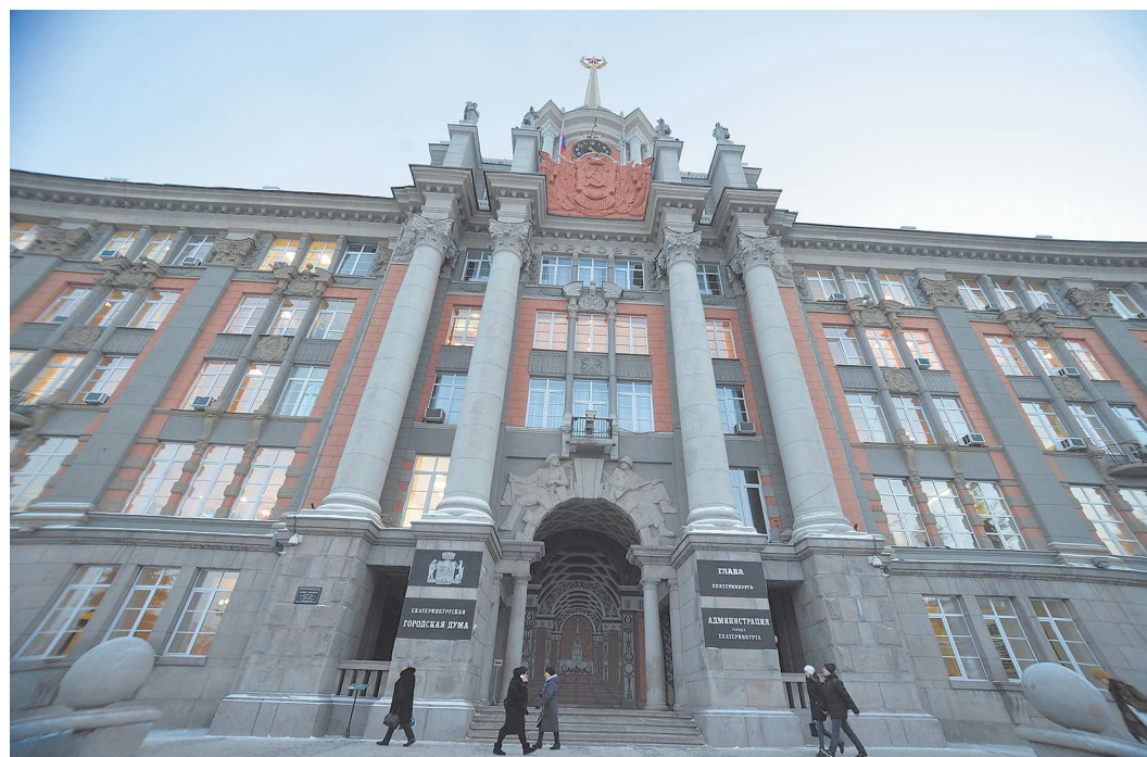
Все расходные обязательства, взятые городом в этом году, будут выполнены и в следующем