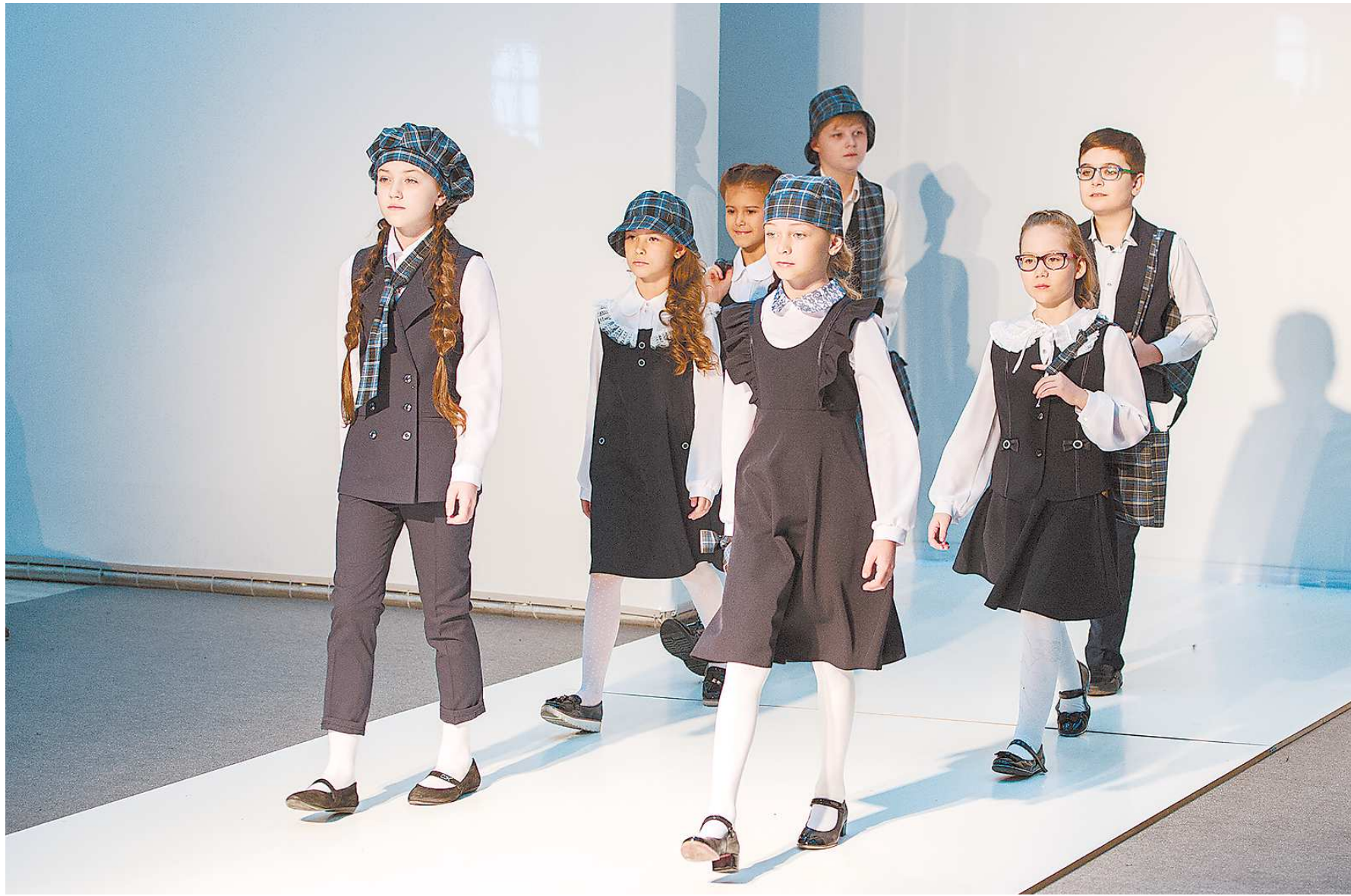
Школьная форма должна быть безопасной, элегантной и красивой, говорят учителя

Разработка полноценного национального стандарта на школьную форму уже началась, написали накануне «Известия» со ссылкой на Роскачество. Отмечается, что при разработке стандарта будут жестко соблюдены требования по ряду показателей, таких как гигроскопичность (способность ткани впитывать влагу) и воздухопроницаемость (способность ткани пропускать воздух). ГОСТ распространится на пиджаки, жакеты, сарафаны, брюки, свитшоты и бомберы. Издание сообщает, что введение стандарта позволит отградить детей