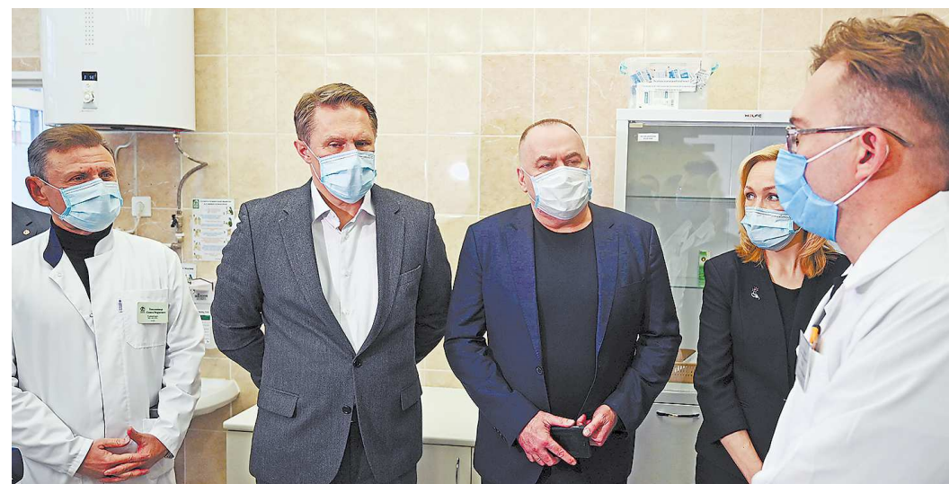
Министр здравоохранения РФ Михаил Мурашко (на фото – второй слева) посетил в Екатеринбурге поликлинику № 1 ЦГБ № 20

Глава Минздрава посетил в Екатеринбурге поликлинику № 1 Центральной городской больницы № 20 (ЦГБ). Медицинскую помощь в ЦГБ получают более 78 тысяч екатеринбуржцев. Здесь работает круглосуточный стационар на 307 коек. В учреждении действует терапевтическая служба, в нее включены отделения кардиологии, неврологии. Помощь пациентам оказывают врачи хирургической и акушерско-гинекологической служб.