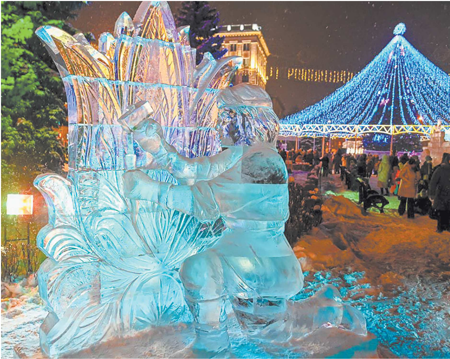
От дорогостоящих салютов в городах нынче отказываются, но полностью лишать детей зимних радостей не стали

В ряде городов традиционно строят ледовые городки по мотивам сказок и мультфильмов. Главными героями ледового городка на Театральной площади Нижнего Тагила станут герои любимых детских произведений: Буратино, Алеша Попович, Винни Пух, Заяц и Волк из «Ну, погоди!», Кот Леопольд и другие персонажи. Центром