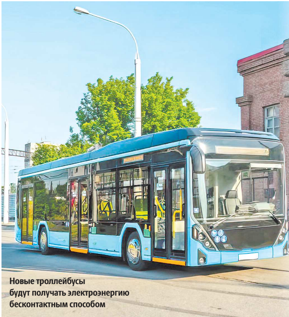
Новые троллейбусы будут получать электроэнергию бесконтактным способом

Как рассказали «ОГ» в «Гортрансе», большинство троллейбусов, выходящих сегодня на маршруты в уральской столице, выпущены в 1980–1990 годы. Это высокопольные машины марки ЗиУ-682 – самой популярной в Советском Союзе. По техническому регламенту их амортизационный срок составляет 12 лет. По факту же срок службы «рогатых» уже достиг 23 лет, а пробег – несколько миллионов километров. Единственное новое поступление за все это время было в 2011 году – тогда Екатеринбург получил два новых троллейбуса вологодского производства.