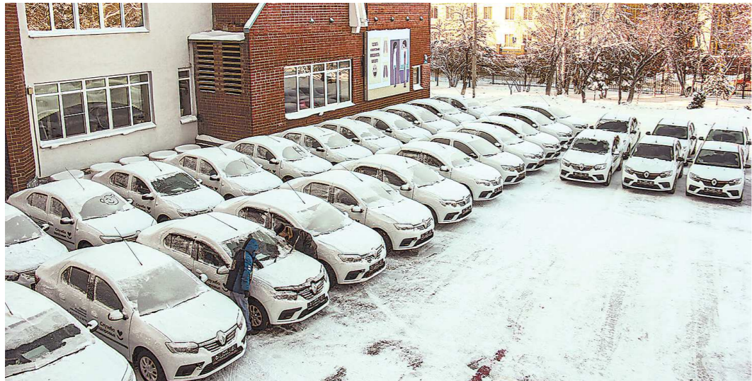
На закупку автомобилей было потрачено более 52 млн рублей

Свердловским больницам передали 40 автомобилей