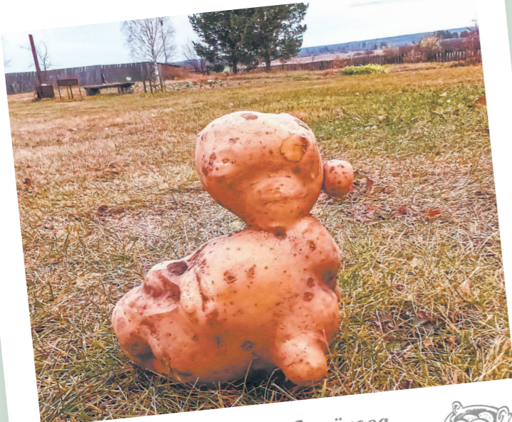
Евгений БУКЛОВ / д. Семёнова

До рекорда Свердловской области (5 кг) не дотянула, но результат впечатляет – почти 2,8 кг