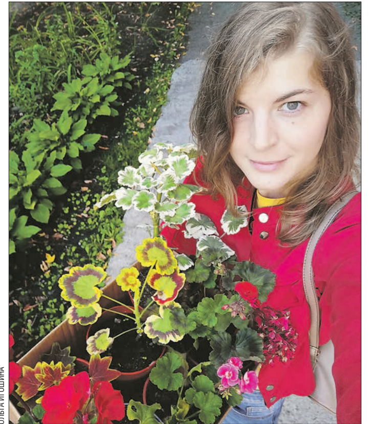
Владелица довольно внушительной коллекции ящериц (около 40 особей) увлекается ещё и цветами

от них ждёшь малышей, встаёшь в очередь, а то и доплачиваешь. Перевозить через всю Россию, выращиваешь.