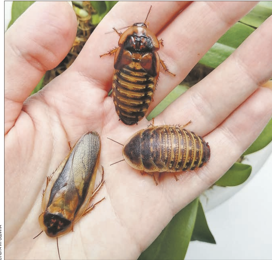
Тараканы, которых выращивают на корм ящерицам, тоже требуют особого ухода

Тараканы для питания ящериц у Ольги особенные, с