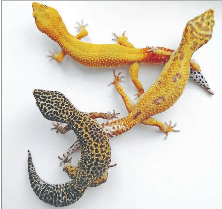
Зубляфы бывают разных расцветок, некоторые из них не встречаются в дикой природе