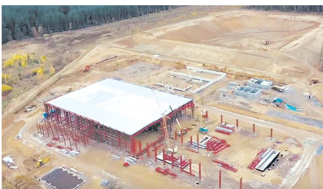
Комплекс в Нижнем Тагиле: монтаж несущих конструкций идет параллельно с настилом кровли