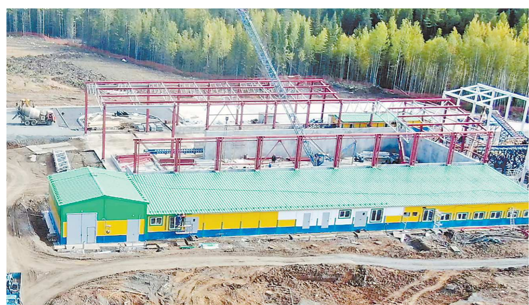
Комплекс в Красноуральске площадью 20,6 гектара будет крупнейшим на севере региона