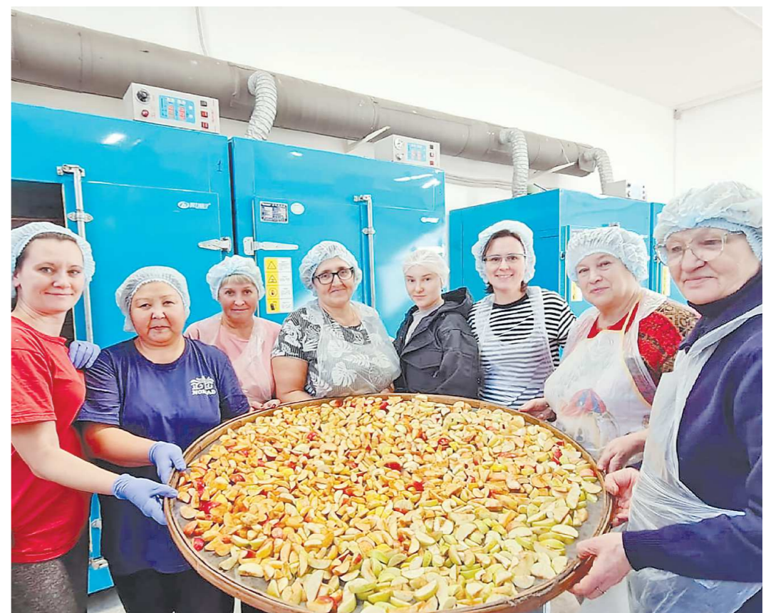
Перерабатывали яблоки перед сушкой сами садоводы и сотрудники компании, которая предоставила оборудование