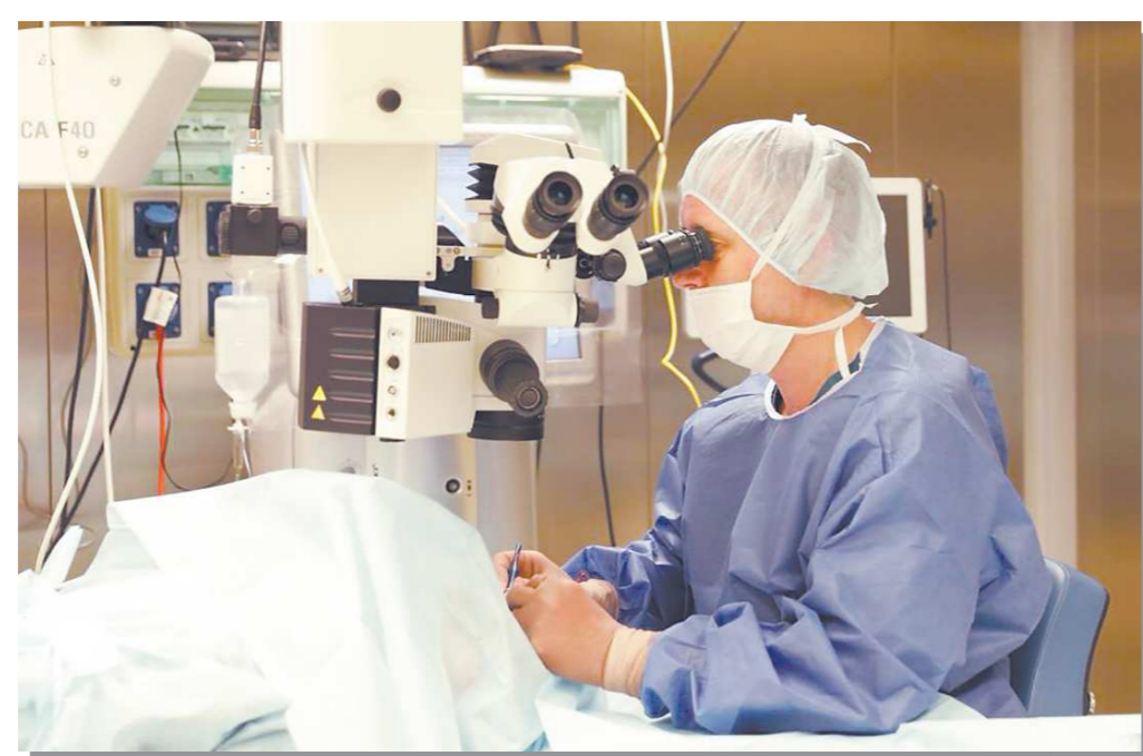
В операционной центра рефракционно-лазерной хирургии

– Прооперировали и практически сразу отпускаем человека домой. Мы не говорим, что он на следующий день может на работу идти. Требуется время, чтобы зрение восстановилось. Ведь эта операция, как и любая