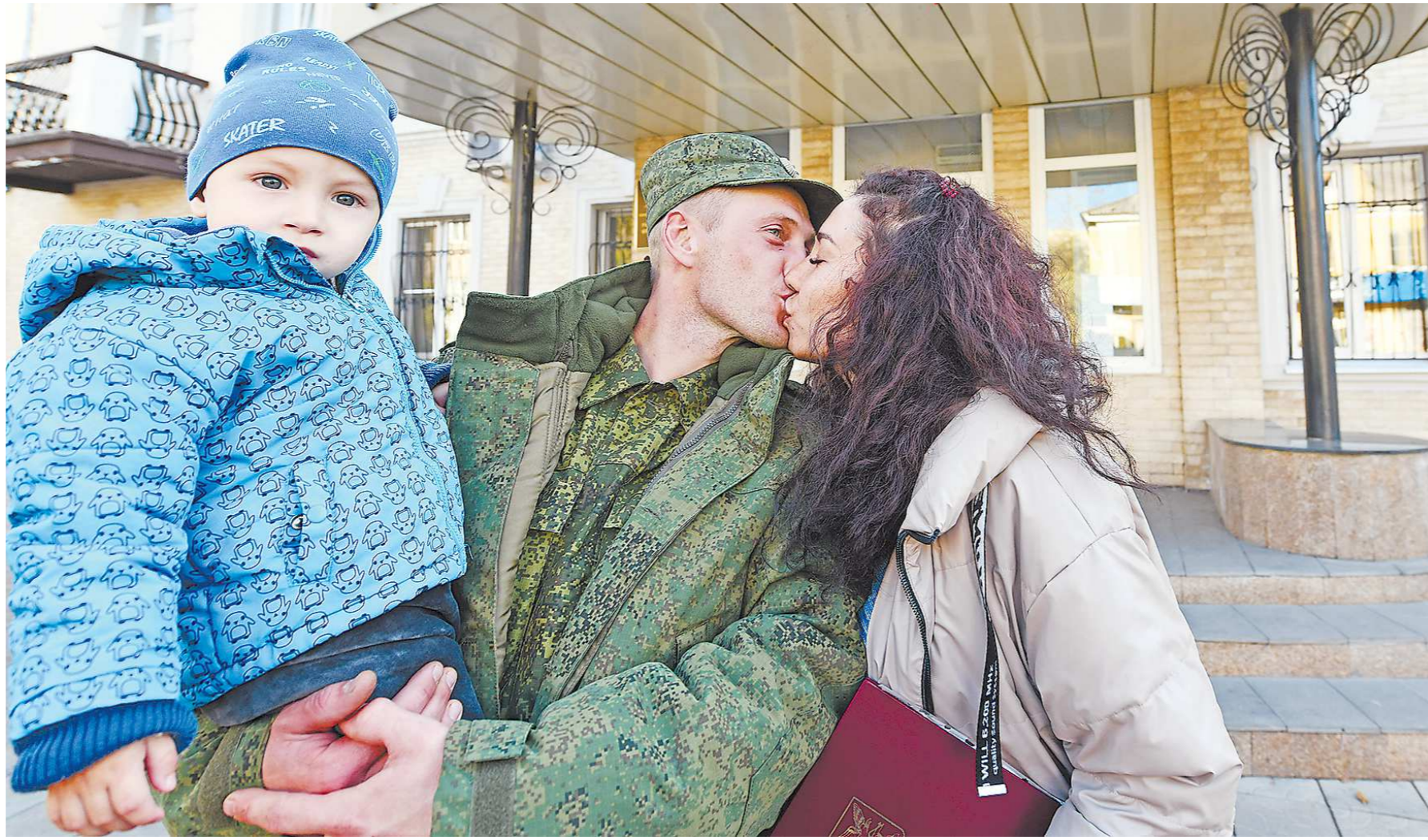
Для детей свердловчан, участвующих в спецоперации, предусмотрены меры поддержки как регионального, так и местного уровня