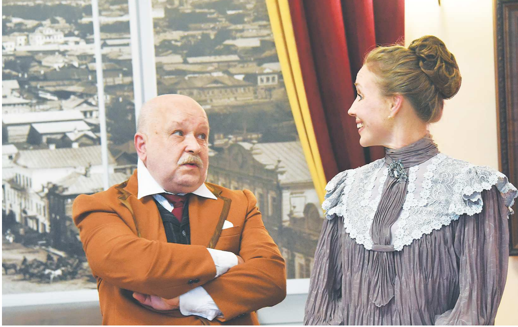
На открытии выставки актеры Камерного театра представили фрагмент спектакля «Золотопромывальники» по единственной пьесе Мамина-Сибиряка. Герои – в конфликте: одни разоряются, другие лукавят и богатеют. «Совестно должно быть...» – «Нет!»

Начинать, конечно, надо с той половины зала, где про открытие и добычу уральского золота. Меха и кринолины «от золотопромывальников» выглядят, как и говорить, завлекательной. И все же сначала – в мир старателей. Лоток для промывки золота, ковш старательский, бадья присковая... О чем-то знаем по фильмам, какие-то названия помним из книг. Но большинство из нас вряд ли подошли столь близко к этому миру, когда даже предметы начинают «рассказывать». О том, например, как уральский старообрядец Еро-