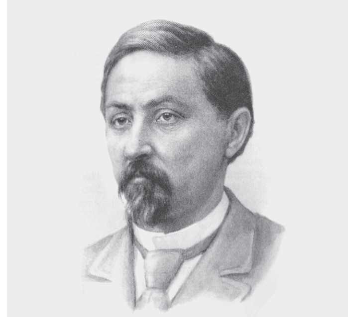
Два мира, два образа

И все же он остался «белой вороной» своего времени. То ли не умел себя продвигать, тем более – в столичной среде. То ли невероятные взлеты и падения уральских золотопромывальников, внезапное богатство и трагедия людей, связавших свою жизнь с золотом, не были интересны столицам, виделись мелкой, «провинциальной» темой. Так или иначе Мамин-Сибиряк был незаслуженно не признан при жизни. С горечью писал: «Жалеть мне в литературе нечего, она всегда для меня была мачехой». Тогда. А сейчас? На открытии выставки справедливо подчеркнуты: «Мамин-Сибиряк – системообразующая единица уральской культуры, элемент нашего культурного кода». Но среди гостей были люди, которые и так это понимают – представители культуры и вузовской среды Екатеринбурга, интеллектуалы-бесребренники. Увы, иных на выставке замечено не было.