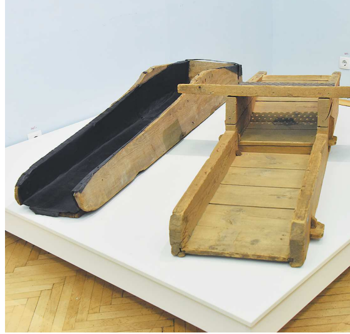
Специально для этой экспозиции из музейных фондов отреставрированы и впервые показаны инструменты золотодобытчиков. Например, вахгерд для промывки золотосодержащего песка