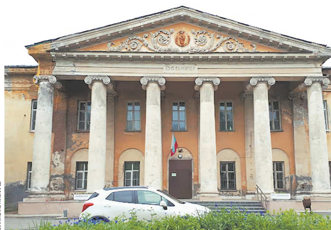
До отмены крепостного права Демидовская больница содержалась исключительно за счёт Демидовых. Затем финансирование стало паевым: часть суммы жертвовали хозяева, остальное – за счёт рабочих, проходивших лечение

Как сообщили в пресс-службе мэрии Нижнего Тагила, исторический фасад зда-