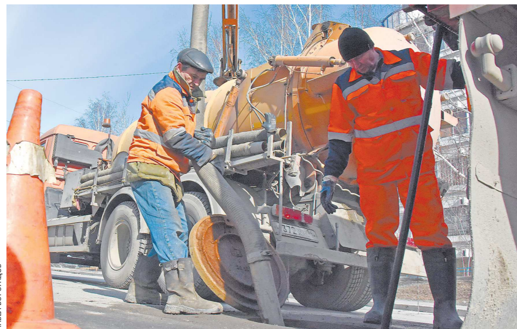
Чем меньше многоквартирный дом и чем просторнее в нем квартира, тем больше плата за вывоз ЖБО

В итоге, плата за вывоз ЖБО рассчитывается не по показаниям счетчиков или нормативам, а по специальной формуле: стоимость вывоза общедомового объема отходов за определенный период делится на площадь всех квартир и нежилых помещений (без учета общего пользования) и умножается на площадь конкрет-