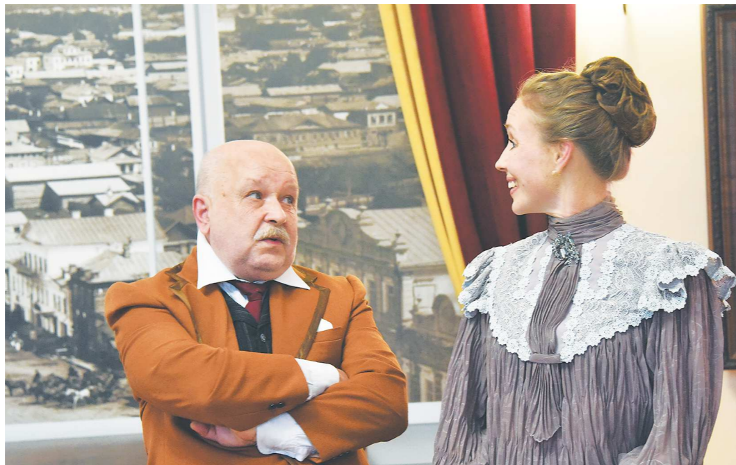
На открытии выставки актеры Камерного театра представили фрагмент спектакля «Золотопромшленники» по единственной пьесе Мамина-Сибиряка. Герои – в конфликте: одни разоряются, другие лукавят и богатеют. «Совестно должно быть...» – «Нет!»

Начинать, конечно, надо с той половины зала, где про открытие и добычу уральского золота. Меха и кринолины «от золотопромшленников» выглядят, как и говорить, завлекательней. И все же сначала – в мир старателей. Лоток для промывки золота, ковш старательский, бадья присковая... О чем-то знаем по фильмам, какие-то названия помним из книг. Но большинство из нас вряд ли подошли столь близко к этому миру, когда даже предметы начинают «рассказывать». О том, например, как уральский старообрядец Еро-