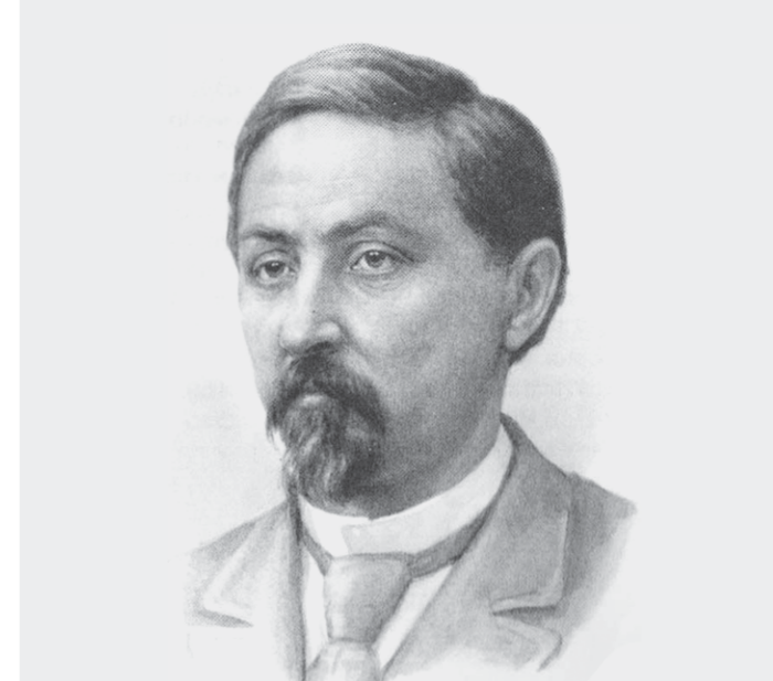
Два мира, два образа

И все же он остался «белой вороной» своего времени. То ли не умел себя продвигать, тем более – в столичной среде. То ли невероятные взлеты и падения уральских золотопромшленников, внезапное богатство и трагедия людей, связавших свою жизнь с золотом, не были интересны столичам, виделись мелкой, «провинциальной» темой. Так или иначе Мамин-Сибиряк был незаслуженно не признан при жизни. С горечью писал: «Жалеть мне в литературе нечего, она всегда для меня была мачехой». Тогда. А сейчас? На открытии выставки справедливо подчеркивалось: «Мамин-Сибиряк – системообразующая единица уральской культуры, элемент нашего культурного кода». Но среди гостей были люди, которые и так это понимают – представители культуры и вузовской среды Екатеринбурга, интеллектуалы-бесребренники. Увы, иных на выставке замечено не было.