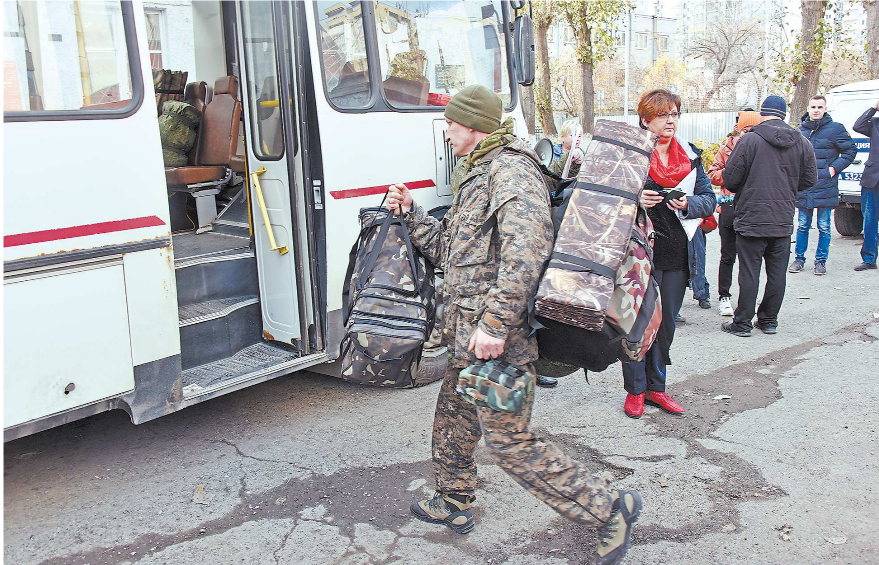
Автобусы из уральских военкоматов вновь направляют в центр подготовки в Елань