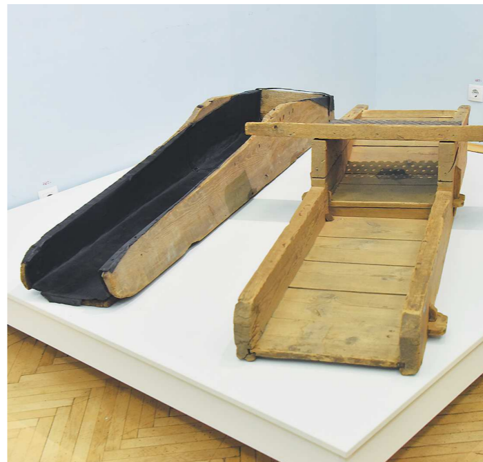
Специально для этой экспозиции из музейных фондов отреставрированы и впервые показаны инструменты золотодобытчиков. Например, вахгерд для промывки золотосодержащего песка