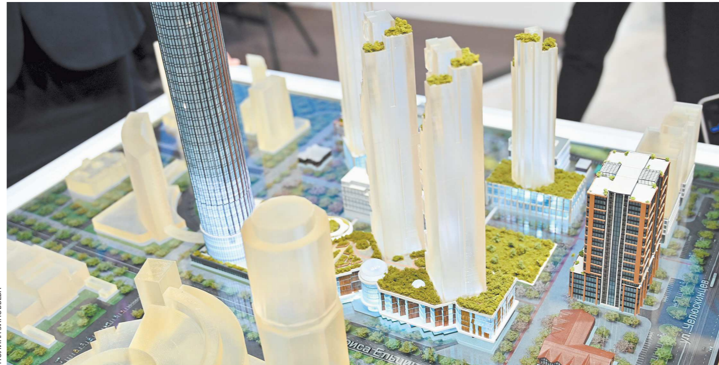
На макете представлено высотное настоящее и будущее набережной Исеты в Екатеринбурге