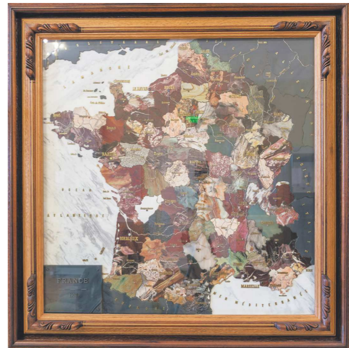
Ответы присылать на электронную почту konkurs_oblgazeta@mail.ru или по адресу: 620004, Екатеринбург, ул. Малышева, 101, каб. 349. Первых трех участников, давших правильные ответы, мы наградим билетами в Музей истории камерного и ювелирного искусства и сувенирами от «ОГ»