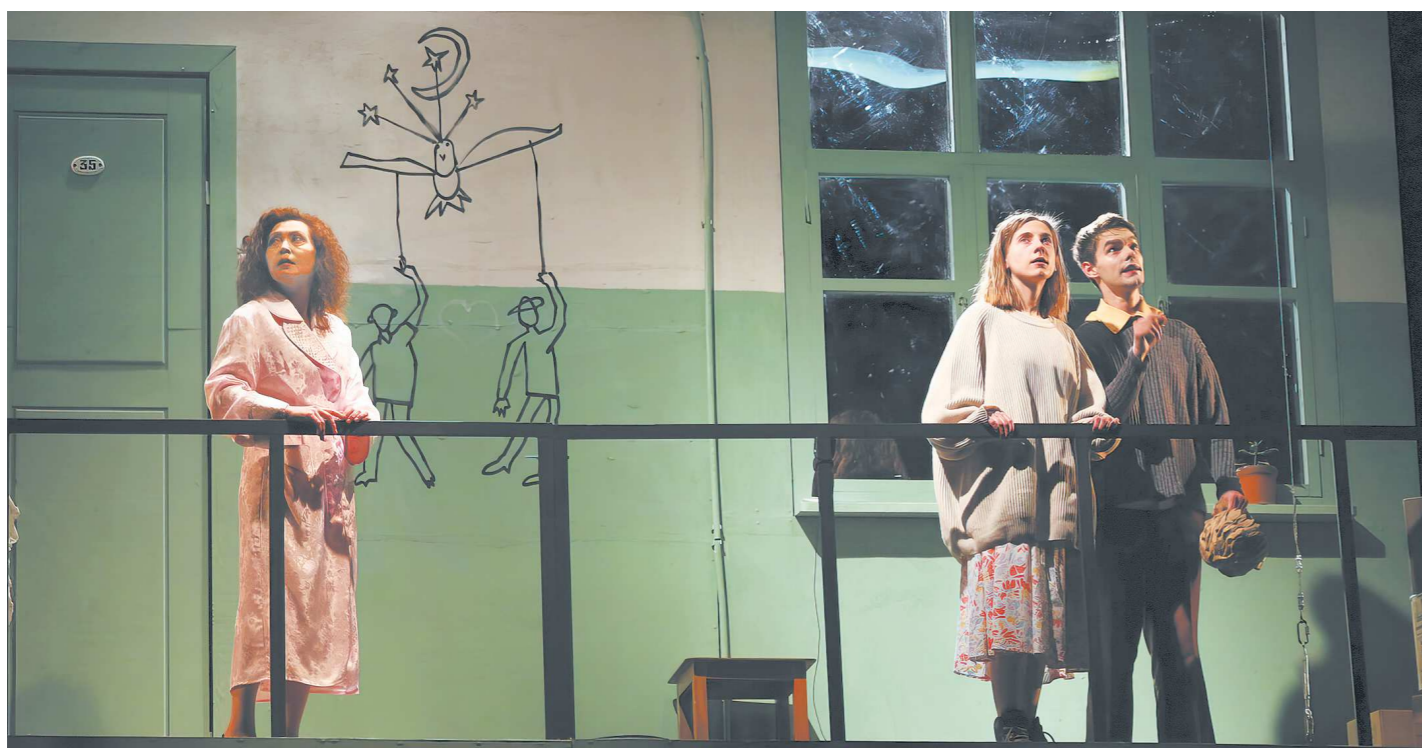
Спектакль «Свободный Тибет» (Драматический театр, г. Саров) посвящен аутсайдерам – людям, которые не вписываются в рамки привычной жизни и остаются на ее обочине. Это – основная программа фестиваля. Но будет и программа для детей

Молодые театральные режиссеры России мигрируют в провинцию