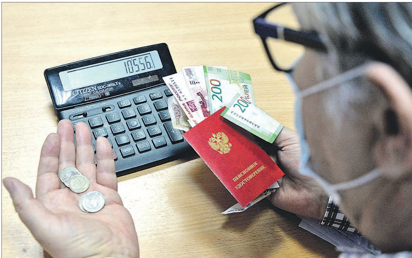
В феврале пенсионеры получат повышенную пенсию

Помимо выплат из ПФР свердловские пенсионеры могут рассчитывать ещё и на областные доплаты. Их в 2022 году проиндексируют на 4 процента.