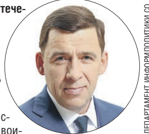
ДЕПАРТАМЕНТ ИНФОРМАЦИОННОЙ ПОЛИТИКИ

Поздравляю вас с Днём победы советских войск в Сталинградской битве.