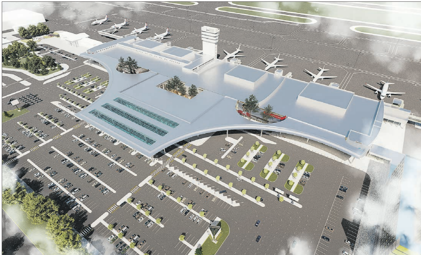
ПРЕСС-СПИЧКА АЭРОПОРТА КОЛЬЦОВО

– Кроме того, в скором времени откроет перелёты Китай, и нам необходимо заранее предусмотреть нали-