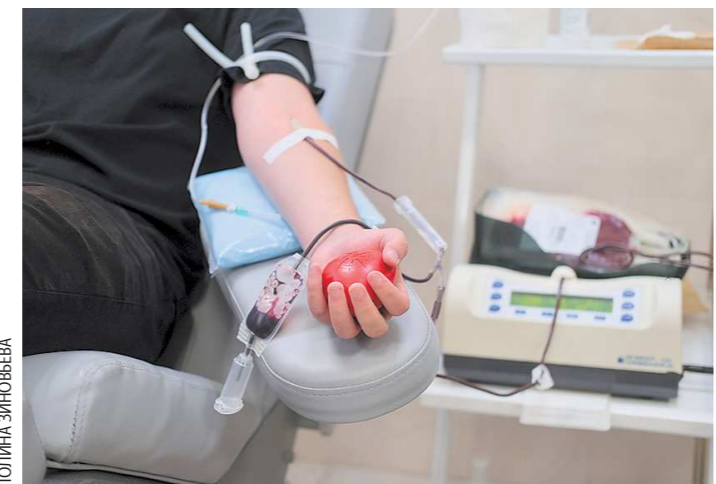
Процедура забора крови обычно занимает около часа

Тем, кто решил стать донором, помимо того что необходимо быть здоровым, в день донации (сдачи крови) нужно позавтракать, но не жирными и не молочными продуктами. Иначе кровь могут забраков-