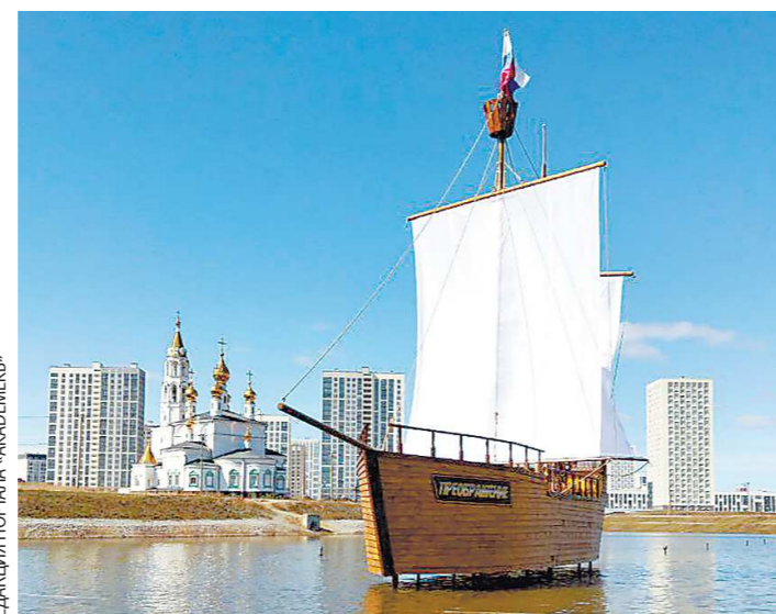
Каравелла «Преображение» появилась в акватории пруда в Академическом весной этого года