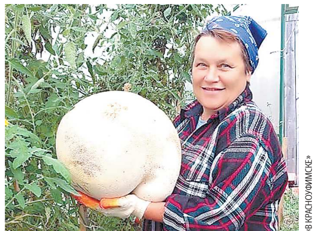
О необычной находке сообщает «В Красноуфимске». Гриб весит шесть килограммов, а по размеру сравним с крупным арбузом.