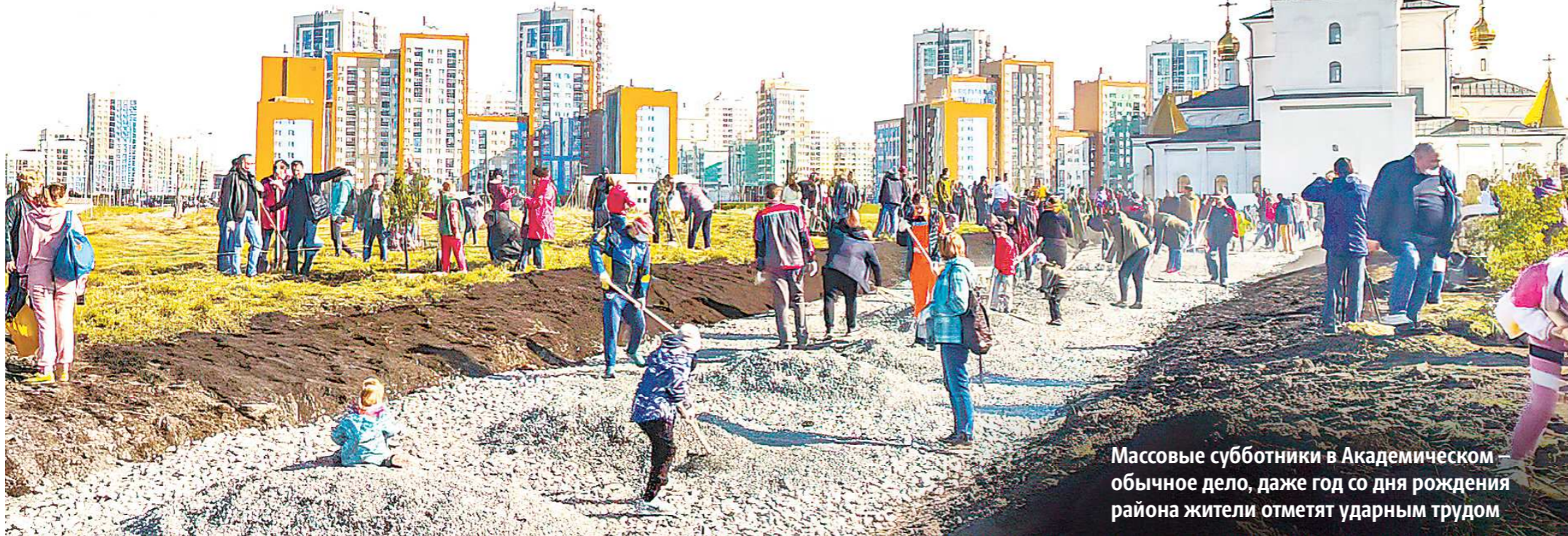
Массовые субботники в Академическом — обычное дело, даже год со дня рождения района жители отметят ударным трудом