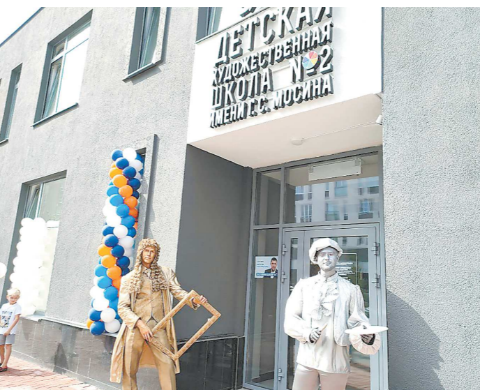
Новый учебный корпус Детской художественной школы №2 им. Г. Мосина открылся в сентябре этого года