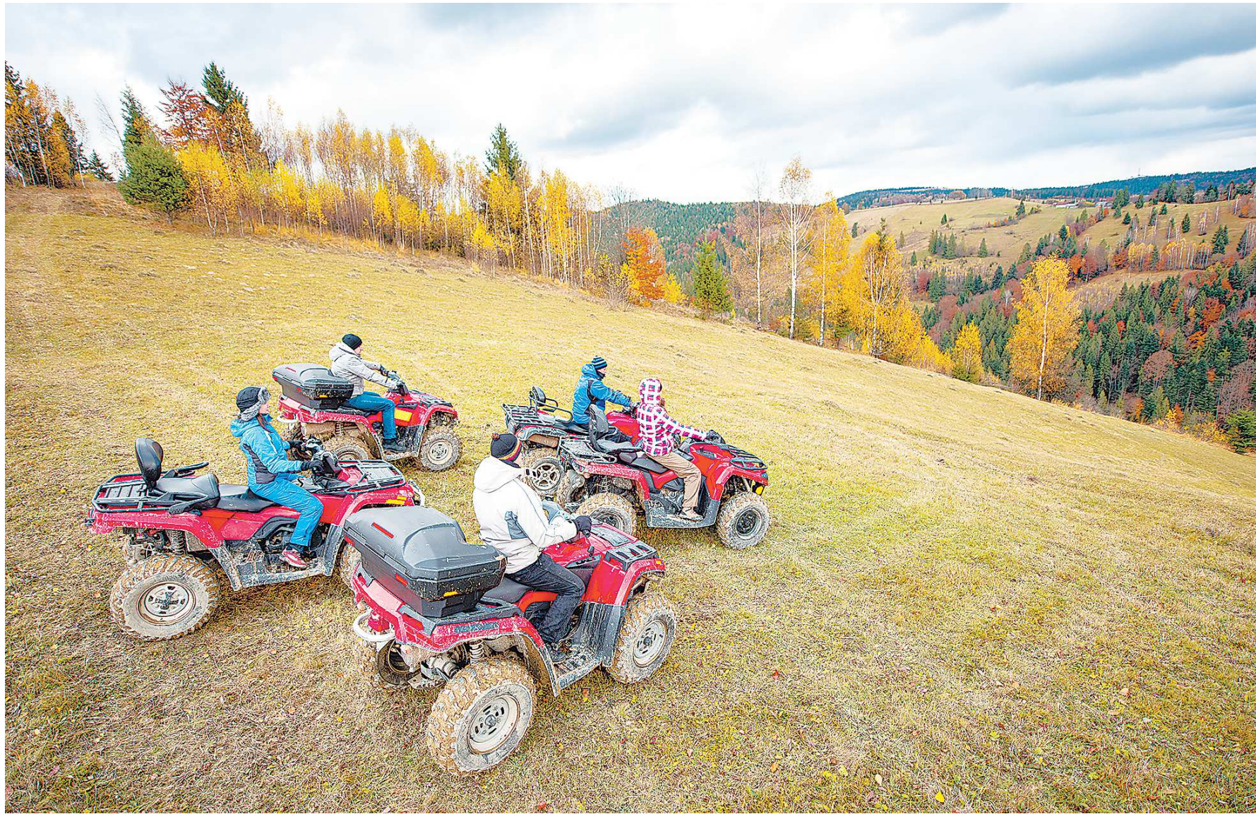
Активный туризм в последние годы становится у россиян все более востребованным

Все мероприятия, проводившиеся в Свердловской области — деловые, культурные, были очень массовыми, они хорошо наполнялись как посетителями, так и профессиональными участниками.