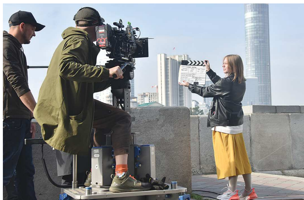
В сценах, отснятых в первый день, зрители увидят самые известные пейзажи Екатеринбурга