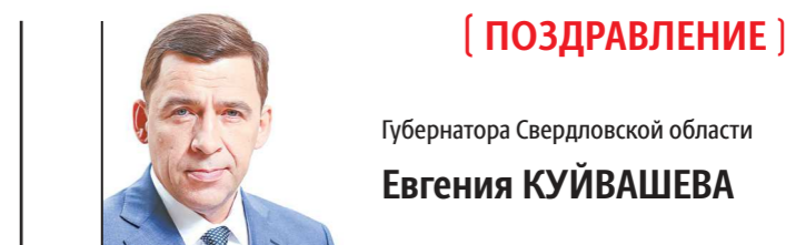
Губернатора Свердловской области Евгения КУЙВАШЕВА