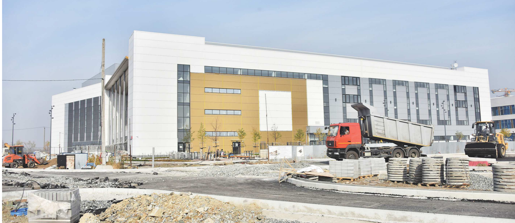
Центр художественной и эстетической гимнастики станет третьим по величине и оснащенности центром гимнастики в России, который спроектирован и построен по международным стандартам FISU. И крупнейшим на Урале и в Сибири. Площадь здания — 22 938 квадратных метров