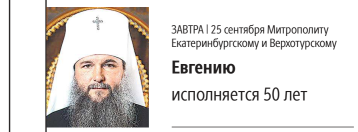
ЗАВТРА | 25 сентября Митрополиту Екатеринбургскому и Верхотурскому Евгению исполняется 50 лет

Поздравительную телеграмму направил губернатор Свердловской области Евгений КУЙВАШЕВ: