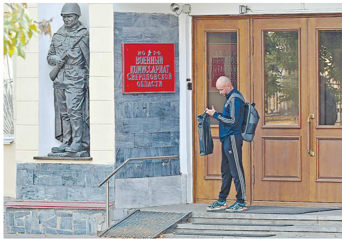
В свердловские военкоматы уже приходят не только мобилизованные, но и добровольцы

выполнение (например, в организациях ОПК);