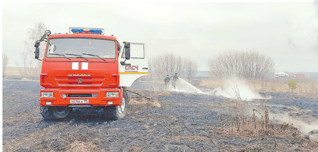
Пожарный автомобиль насосно-рукавный, комбинированный (ПАНРК) – это и пожарная автоцистерна, и мощная насосная станция, и машина для прокладки магистральных рукавных линий

Как сообщили в Главном управлении МЧС по Свердловской области, всего огнеборцами обнаружено 29 возгораний, 17 из них уже ликвидированы. Поиск очагов