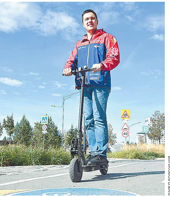
Автогонщику Сергею Карякину покоряются, кажется, все виды транспорта, имеющие колеса