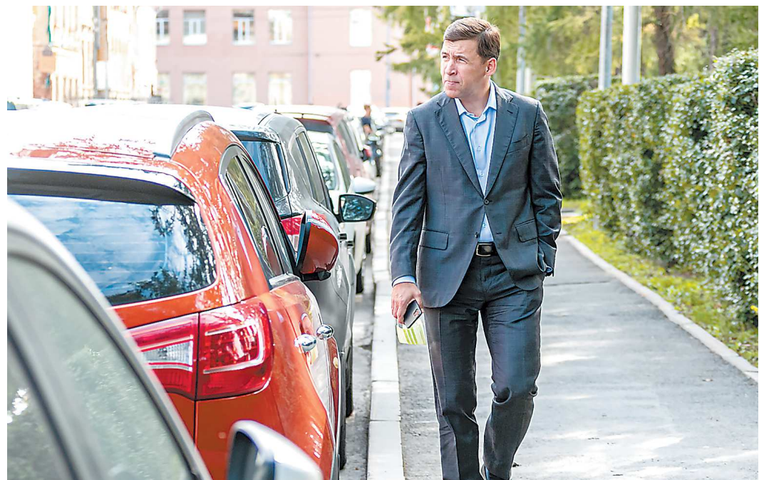
Даже по пути на работу губернатор Евгений Куйвашев на связи и готов решать рабочие вопросы по телефону

... и едущий – на самокате, велосипеде, моноколесе