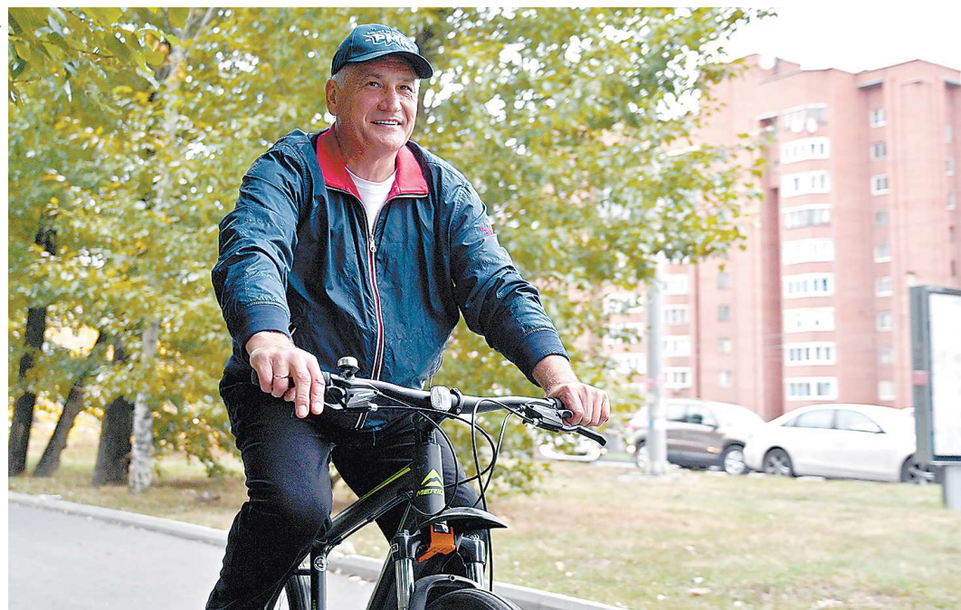
Юрий Биктуганов, и. о. министра образования и молодежной политики, пользуется хорошей погодой и добирается до работы на велосипеде

Сегодня во всем мире проходит «День без автомобиля»: жители мегаполисов отказываются от использования машин и пересаживаются на экологически чистые виды транспорта – велосипеды, самокаты, трамваи, троллейбусы и метро. Пользуется популярностью акция и в Свердловской области. В ней принимают участие много людей: от политиков и спортсменов – до обычных горожан.