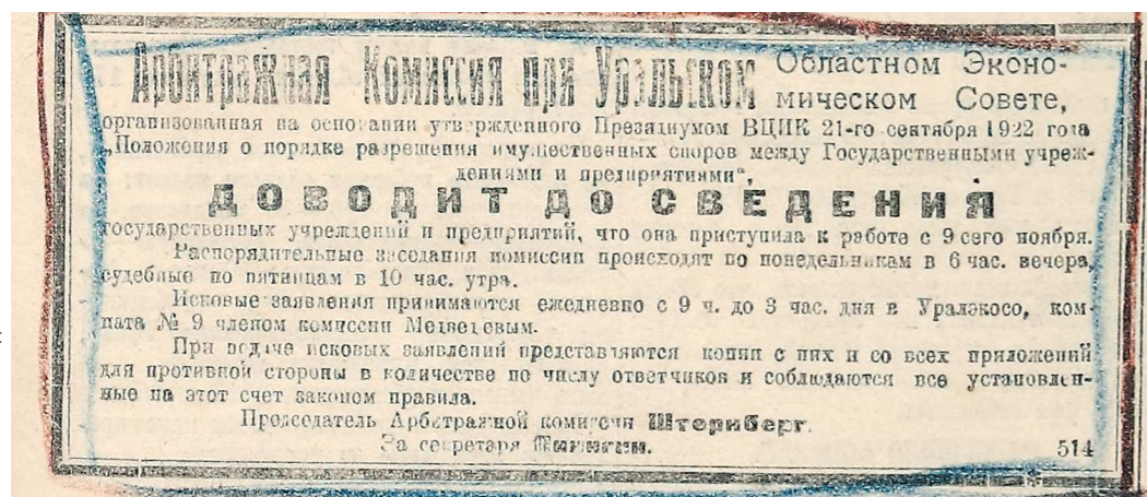
Объявление в газете «Уральский рабочий» о создании Арбитражной комиссии при Областном экономическом совете. 15 ноября 1922 г.