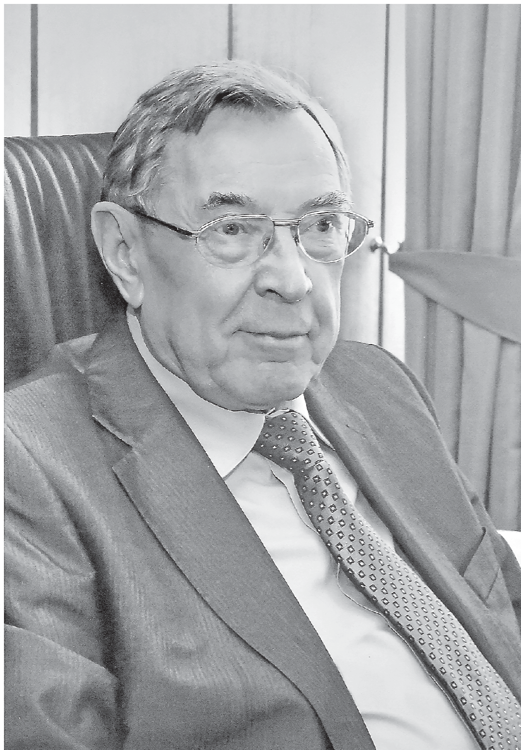
Фотопортрет В. Яковлева из экспозиции Музея Арбитражного суда Свердловской области

21 сентября 1922 года ВЦИК и Совнарком РСФСР издали положение, предусматривающее, что впредь имущественные споры между государственными учреждениями и предприятиями будут разрешаться Высшей арбитражной комиссией при Совете труда и обороны, а на местах – арбитражными комиссиями при областных экономических совещаниях. С этого дня ведется отсчет существования арбитражной судебной системы нашей страны. Организатором и создателем системы арбитражных судов новой России является Вениамин ЯКОВЛЕВ – первый председатель Высшего арбитражного суда РФ, чья судьба тесно связана со Средним Уралом.