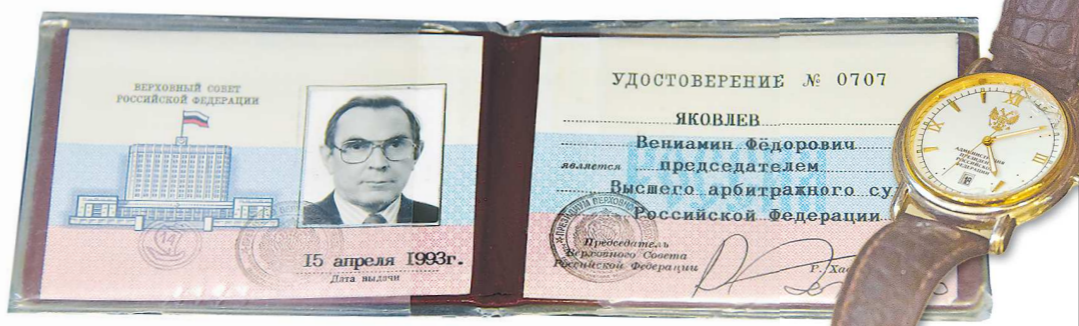
Удостоверение председателя Высшего арбитражного суда РФ, подписанное председателем ВС РФ Р. Хасбулатовым. Часы В. Яковлева – подарок Президента России