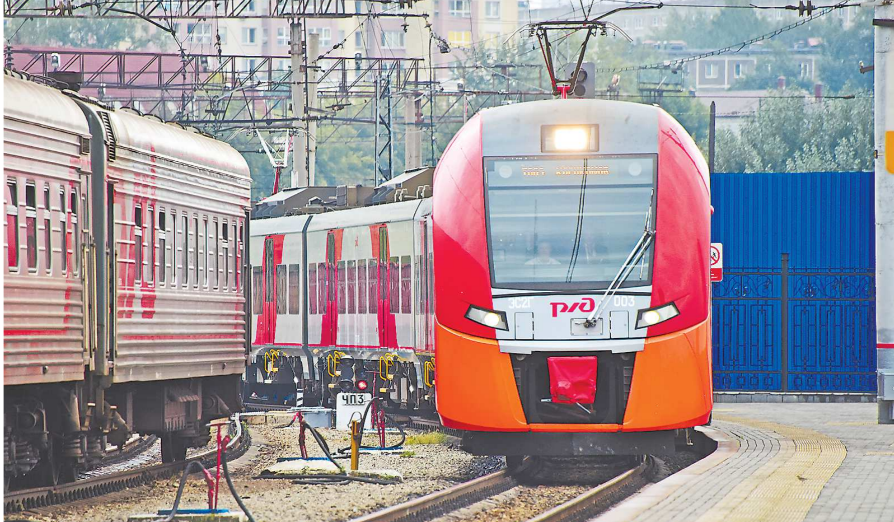
Курсировать по маршрутам наземного метро будут современные электропоезда «Ласточка», всего планируется запустить 22 состава

В июле этого года на международную выставку ИННОПРОМ губернатор