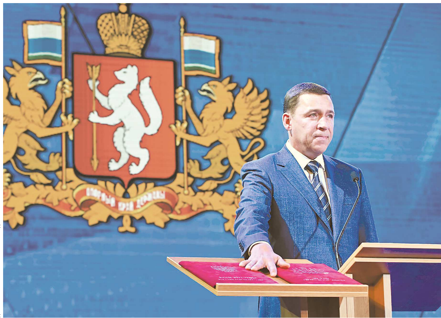
Евгений Куйвашев приносит присягу, положив руку на тексты Конституции Российской Федерации и Устава Свердловской области

Евгений Куйвашев вступил в должность губернатора